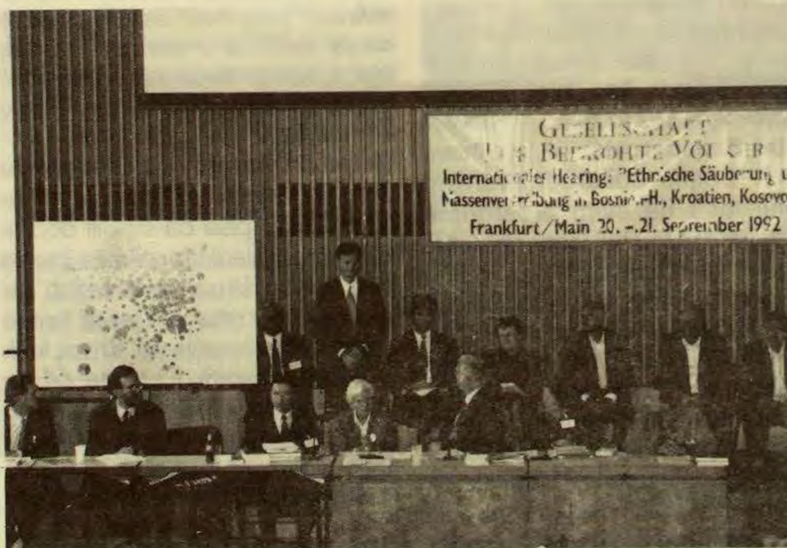
Završetak saslušavanja svjedoka

U zaposjednutim dijelovima Bosne i Hercegovine od strane srpskih trupa većina muslimanskog stanovništva je, ili protjerano, ili okruženo u gradovima, ili se nalaze u zarobljeničkim i koncentracionim logorima. Broj