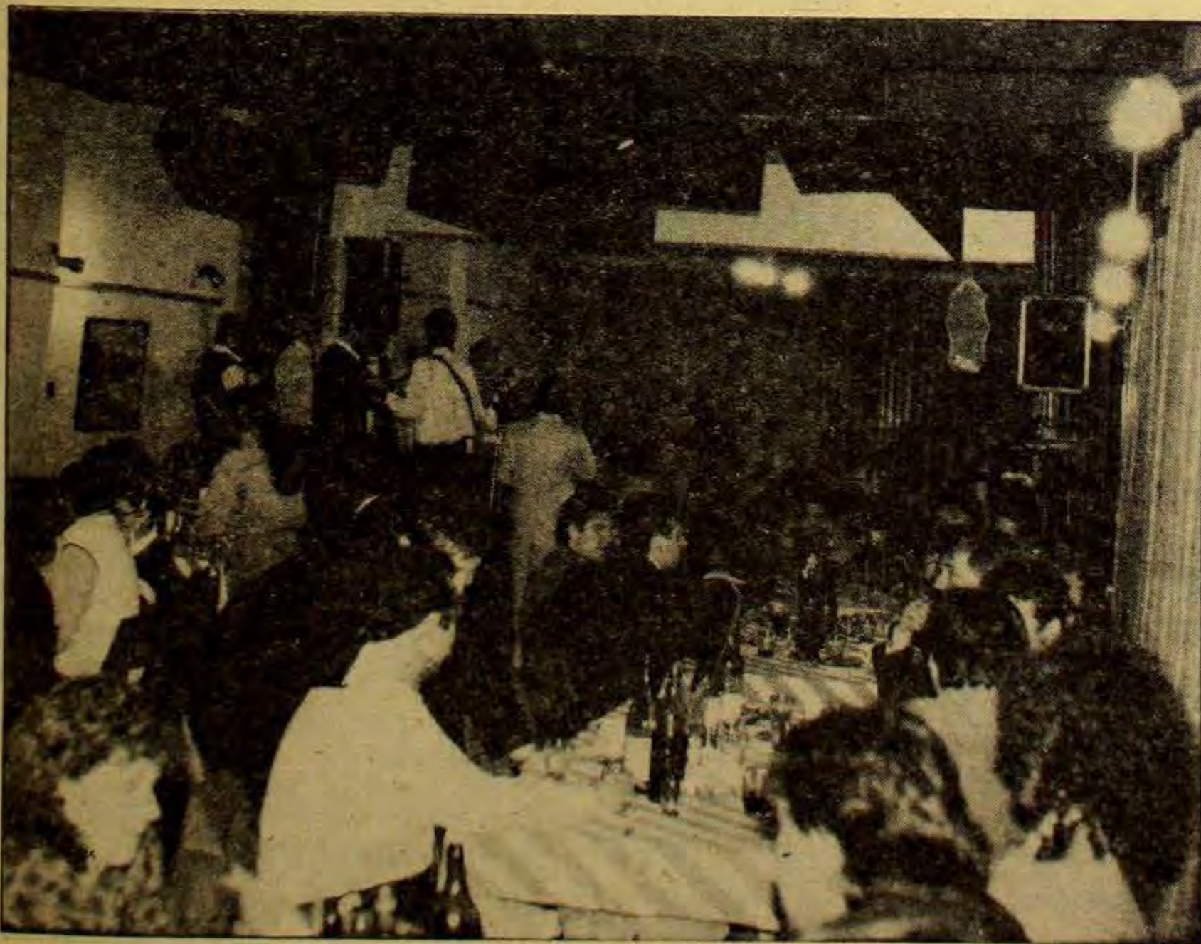
Fešta je tek počela

Brojni psihijatri bi, kada bi vidjeli kako se mirno, a opet veselo može provesti jedna ovakva večer, vjerojatno svojim još brojnijim klijentima preporučili "terapiju glazbom" kao jedan od ključnih načina da se, makar za kratko, si olakša i zaboravi okrutni bljesak koji nam se svakim danom čini sve jačim i bližim. Okus girica "na gradele" (pomalo već zaboravljenih) i maligani uz crno vino toliko su nekima "pasirali" da su vidjeli svoj grad i uz mjesečinu, ali i sa suncem. Što još reći? Valjda je najbolje kada se ne mora pisati o nekakvu izgrednu ili nanesenoj nepravdi.