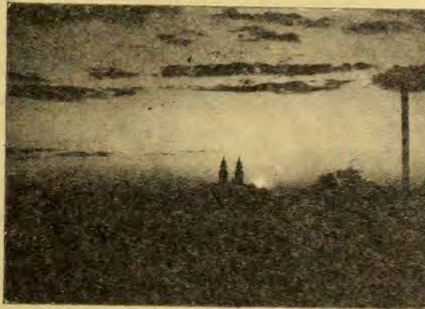
Crkva Marije Terezije u Subotici

Simbolični amanet graničarskog perioda naše varoši možmo vidit na zidovima varoške kuće i u njoj samoj: to je lav s mačom na crvenoj podlogi.