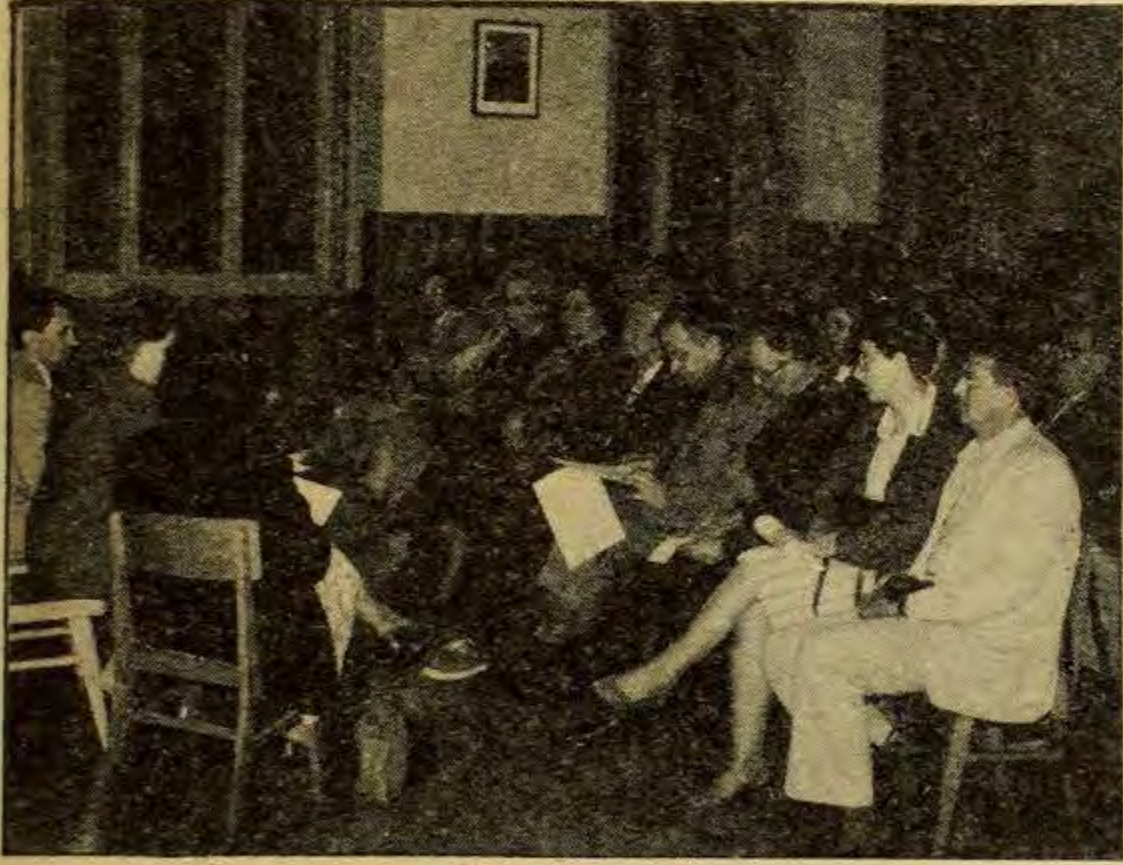
Sa siromaškog astala i mrvice su manje

Subotica - Pod nazivom "Amor vincit" (ljubav pobjeđuje) u Subotici je 6. svibnja osnovana još jedna dobrotvorna organizacija. "Amor vincit", kako su mnogi prisutni na osnivačkom sastanku istaknuli, bi trebao biti pravi nasljednik brojnih prijašnjih dobrotvornih organizacija koje su u Subotici uspješno djelovale prije Drugog svjetskog rata.