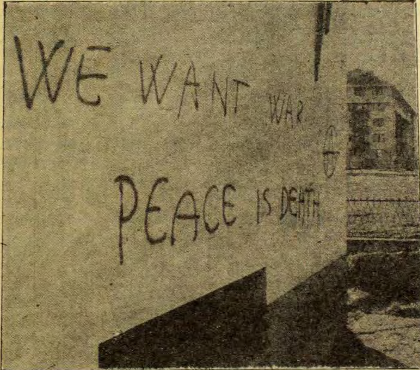
Zbog njih ispaštamo: potpisnici "Rambo" generacije