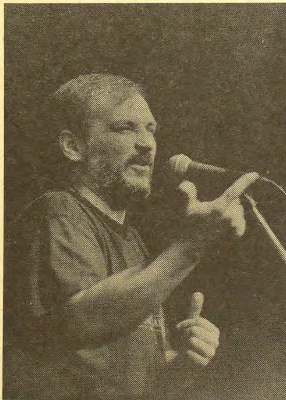
Đole: "Normalni, nazad u mrak!"

Manjinu s utjecajne periferije i moralnog centra sačinjavala je grupica od 5-6.000 autonomaša, secesionista, republikanaca (rekli bi zli jezici), mehaničara, bravara, šustera, imućnijih i onih koji to nisu... ali bez padobranaca. Ulaznica nije stajala nekoliko talona (maraka?); za ulaznicu je bilo potrebno više: neki etički kod koji se prihvaća ili se ne prihvaća, ali se nosi u sebi i za kojega nije potrebno objašnjenje. Da te poznanik slučajno ne obruka pitanjem: "Otkud te-