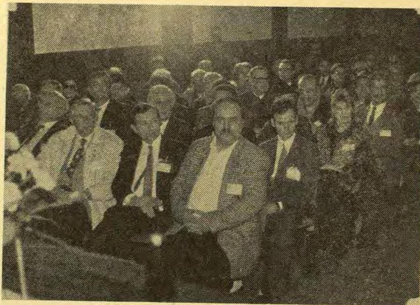
Uzvanici i delegati