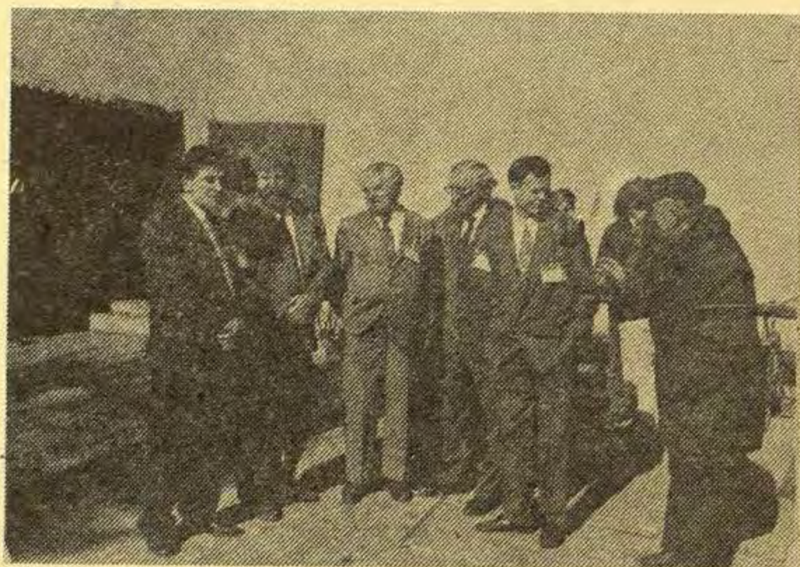
U očekivanju početka rada skupštine