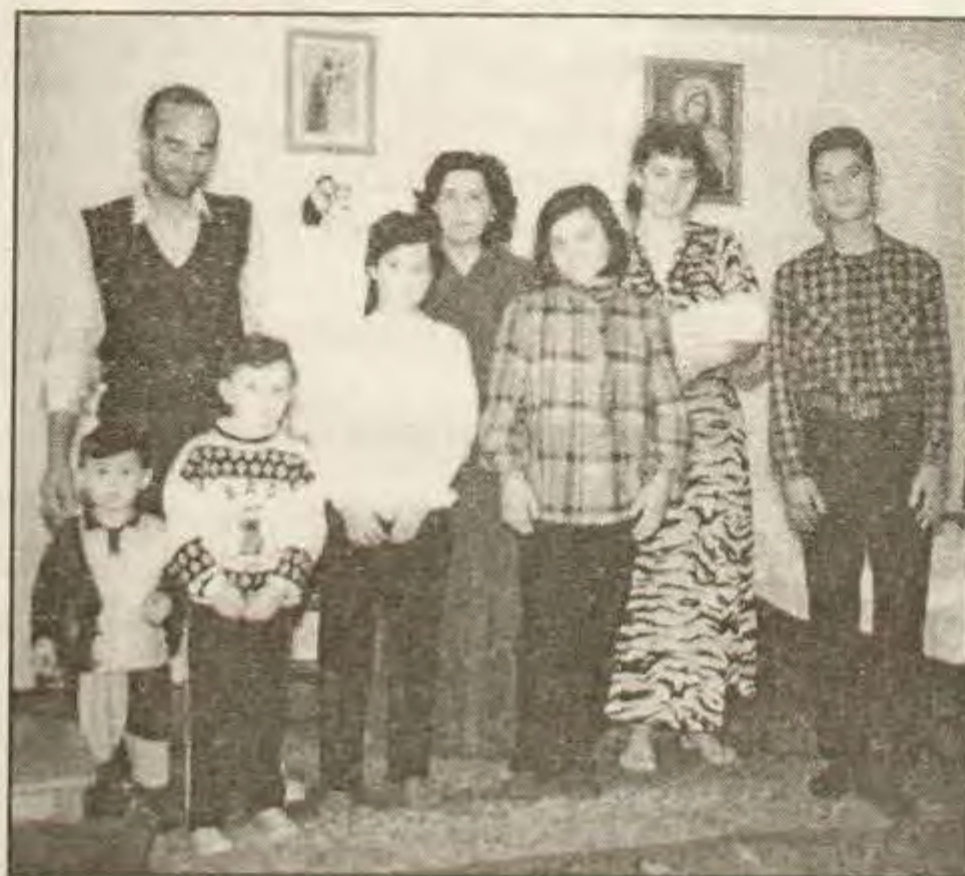
Hrvatska obitelj iz Janjeva

Iseljavanje kosovskih Hrvata još uvijek traje. Međutim postoji određeni broj njih koji su odlučili da ne napuštaju sela u kojima žive već skoro 750 godina. Pred njih se, međutim, postavlja pitanje kako očuvati sebe i svoj identitet u nehrvatskom moru