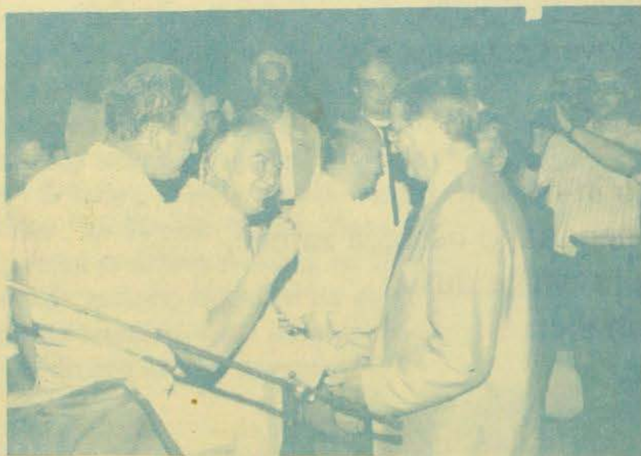
Razgovor s gostima