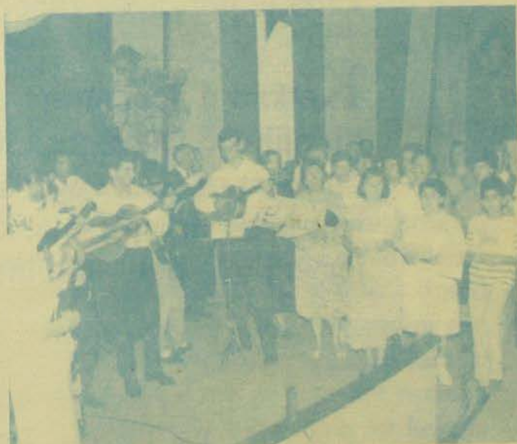
Izvornost naših običaja se osporavala, a često se i danas osporava