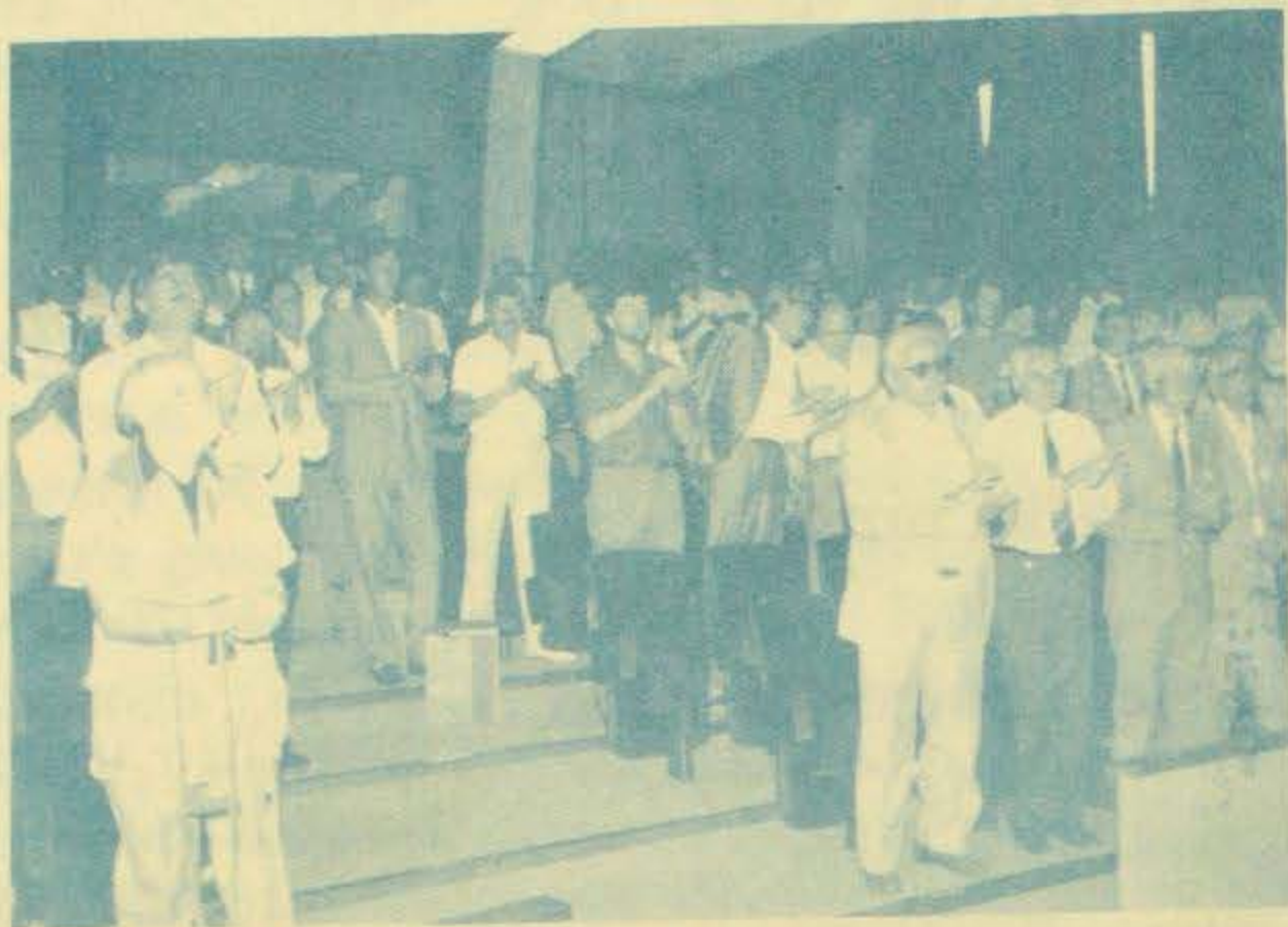
1. Svečano proglašenje osnutka Demokratskog saveza Hrvata u Vojvodini