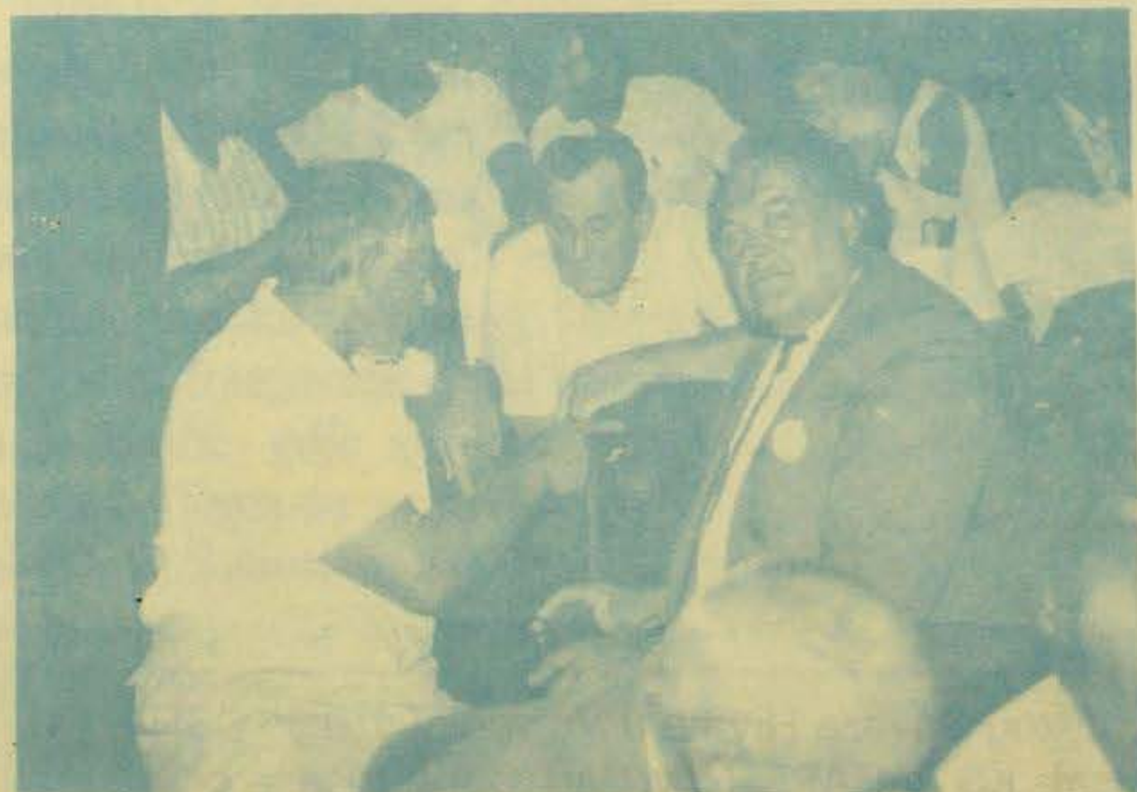
Gosti iz Saveza seljaka