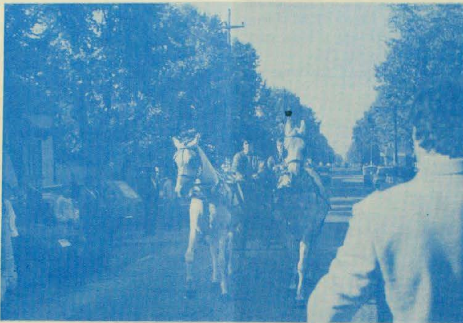
Slankamen: Fijaker za potpredsjednike stranke

Prema procjenama domaćina, osnivačkoj skupštini je prisustvovalo oko 500 mještana Novog Slankamena, od koji je 121 potpisao pristupnicu DSHV-a. Nadamo se da će budući rad podružnice DSHV u Novom Slankamenu i prikupljanje članstva biti jednako tako uspješno kao što je bila organizacija ove osnivačke skupštine.