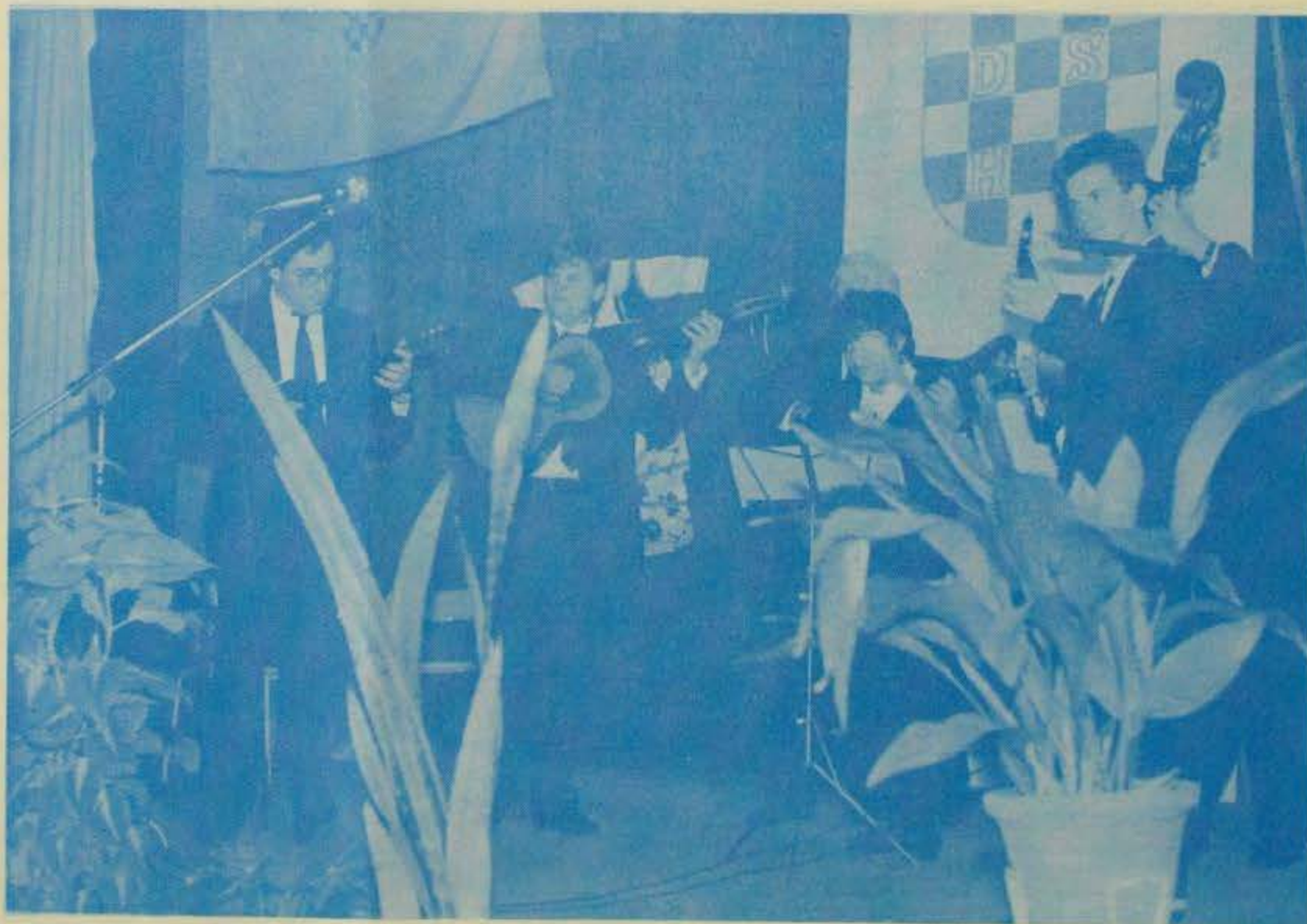
„Nek se znade...” Tavankutski orkestar „Hajo”