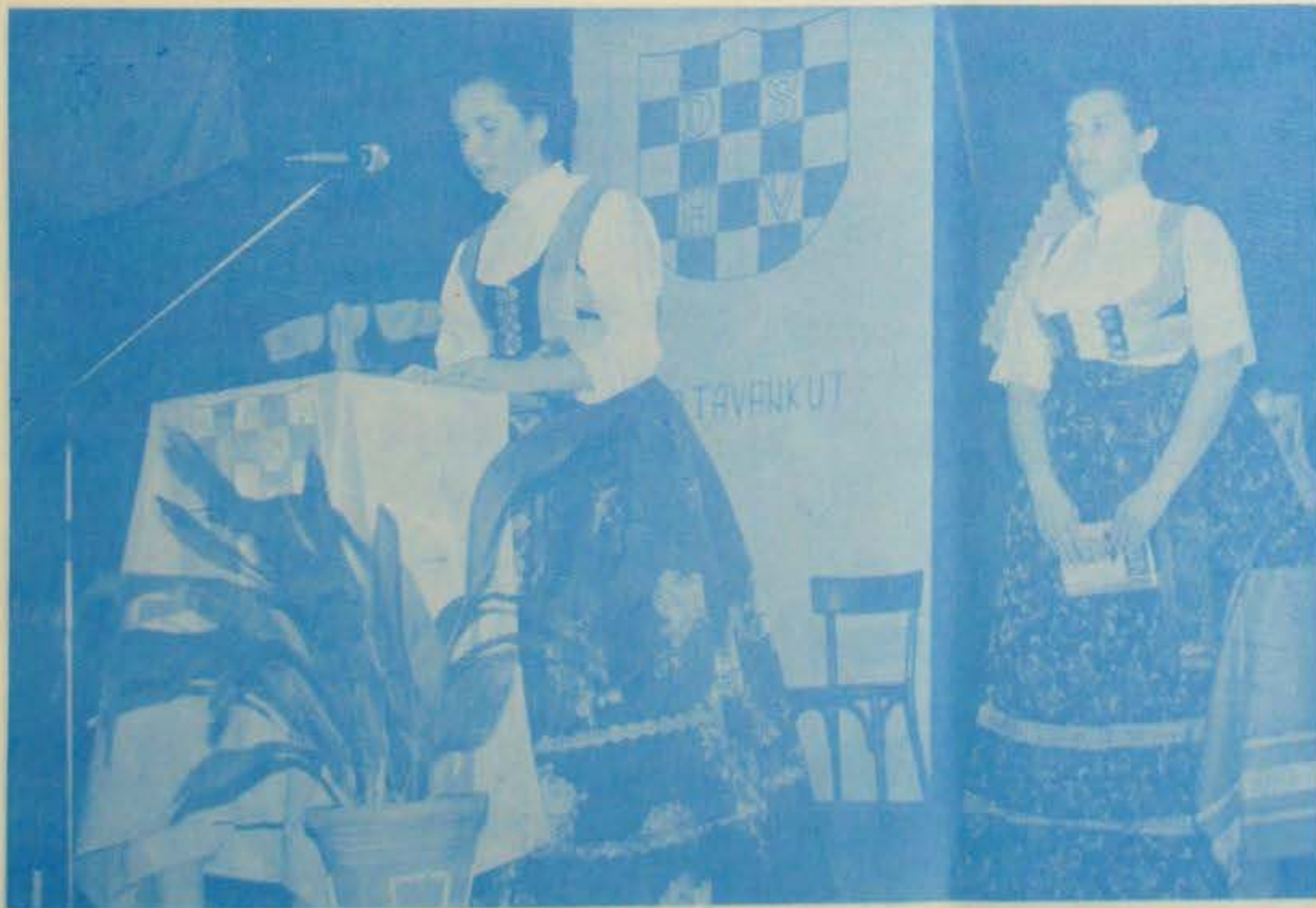
„Bunjevka sam, dika svoje nane”