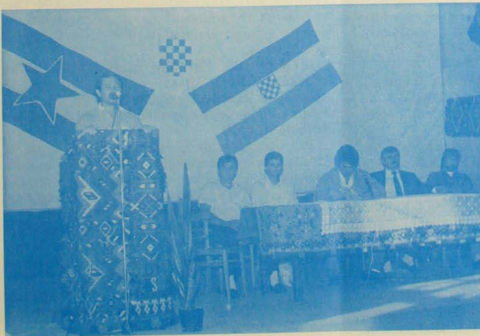
Plavna: Zalaganje za toleranciju i miran suživot

Cijeli skup je odlično uspio. Organi sigurnosti su svoj posao obavili besprijekorno, što je još jedan dokaz da demokratizacija kod nas napreduje krupnim koracima.