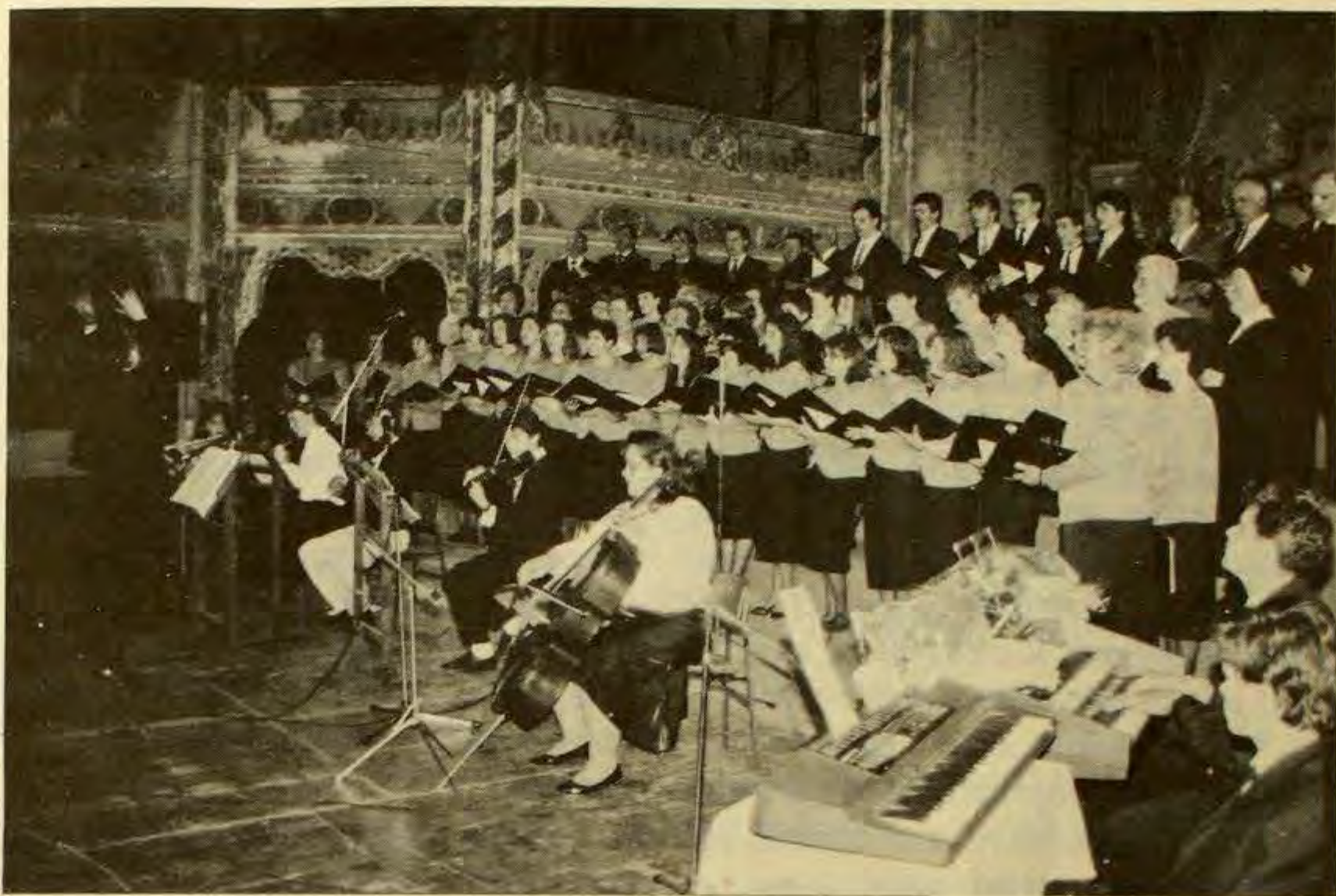
Zbor „Albe Vidaković”