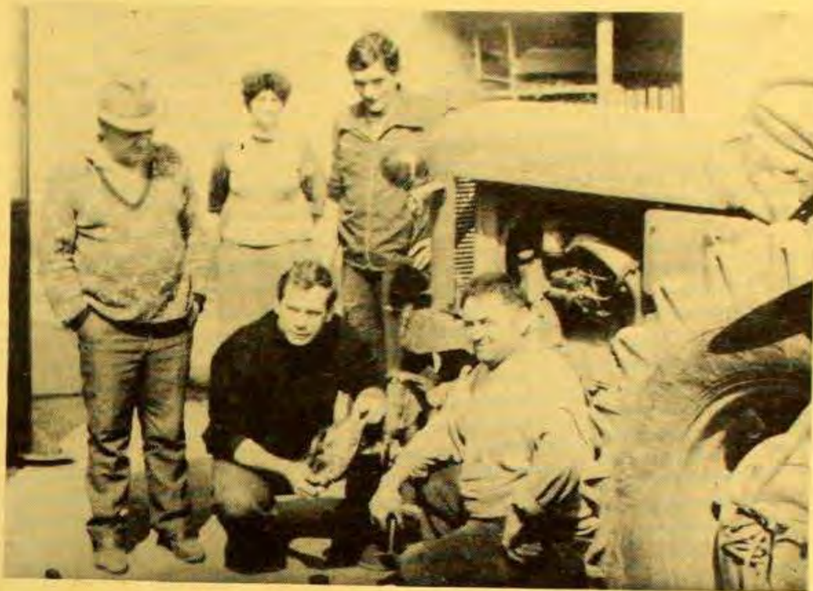
U dvorištu Žugaje: na zajedničkom poslu

Otac mi je bio načelnik Hrvatske seljačke stranke za kotar Zemun prije rata. Spasili su 64 Srbina, ovdje nije bilo ubijanja. Imali smo zadrugu, pjevačko društvo, hrvatsku školu, sada je u njoj