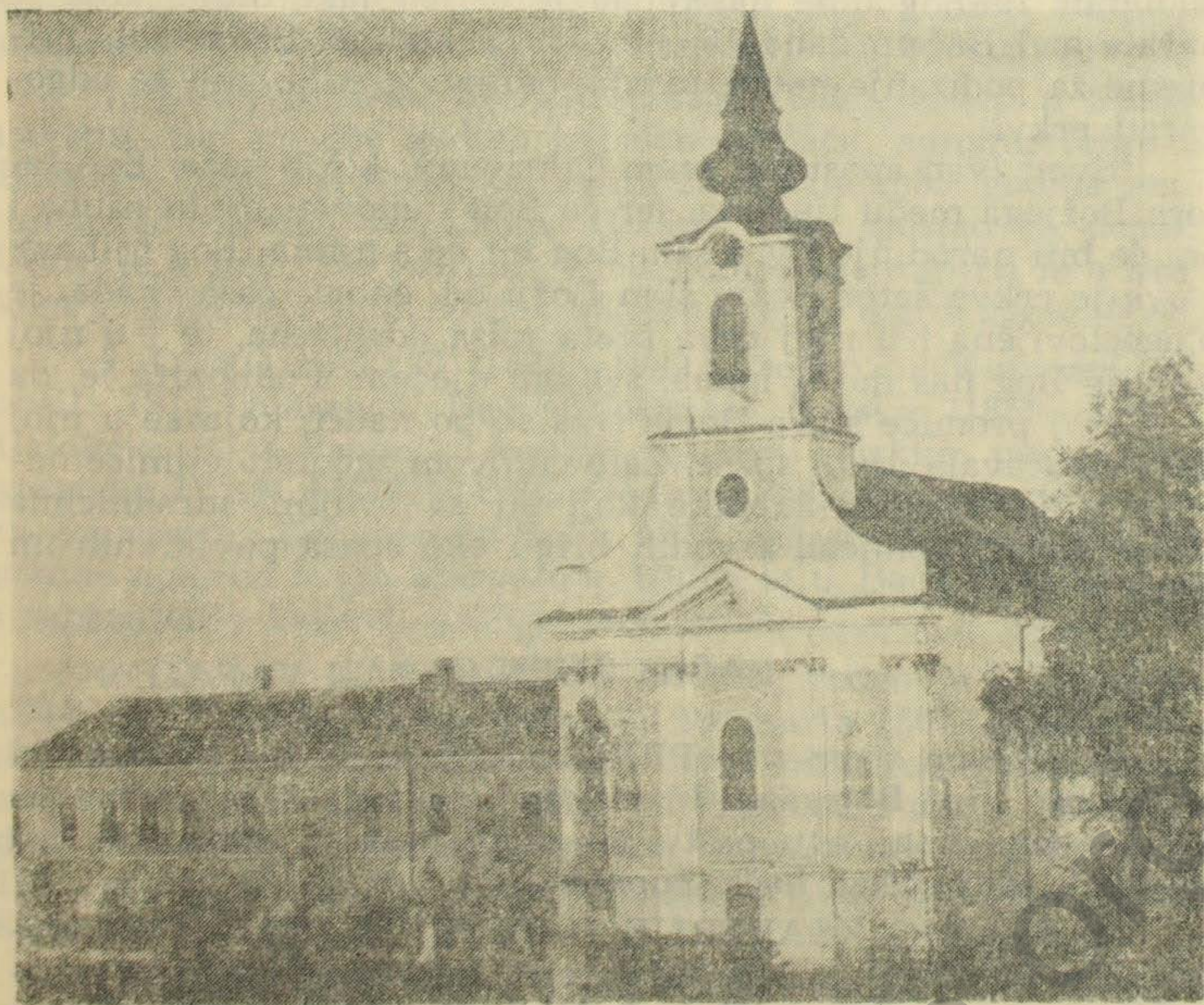
Župska crkva u Baču građena 1773—1780. godine

zi zgrada zabavišta. No sve to nije bitno gdje se ona nalazila, nego kakva je ona bila. Tadašnji kaločki nadbiskup grof Battyány József bio je svjestan toga, te je u Baču, nekadašnjem sjedištu nadbiskupije, vlastitim troškom, uz radnu snagu naroda, sagradio današnju crkvu u čast sv. Pavlu apostolu. Kamen temeljac blagoslovio je 11. jula 1773. godine presvijetli gospodin Glaser, bački prepozit sv. Pavla, a 12. novembra 1780. godine crkva je bila dovršena i blagoslovio ju je generalni vikar presvijetli gospodin Antun Gašljević. Od dana kada je gospodin Glaser, bački prepozit blagoslovio kamen temeljac, kako sam spomenuo 11. jula 1773. godine, prošlo je evo, neka je G. Bogu hvala, 200. godina. Na stogodišnjicu crkve kardinal Hajnald