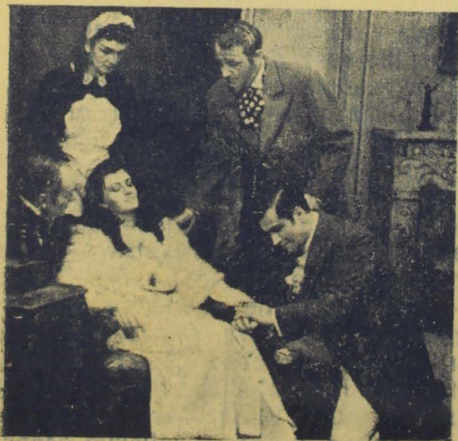
Završni prizor iz opere „Traviata“

Tekintettel a nagy keresettségre, valamint következő bemutatóink kivételes jelentőségére, a „Színpadunk“ e hóban kétszer jelenik meg. A következő szám Shakespeare két vígjátékának: a „Windsori víg nők“ és a „Makrancos hölgy“ ünnepi bemutatóik alkalmából, 1953 február 15-én jelenik meg.