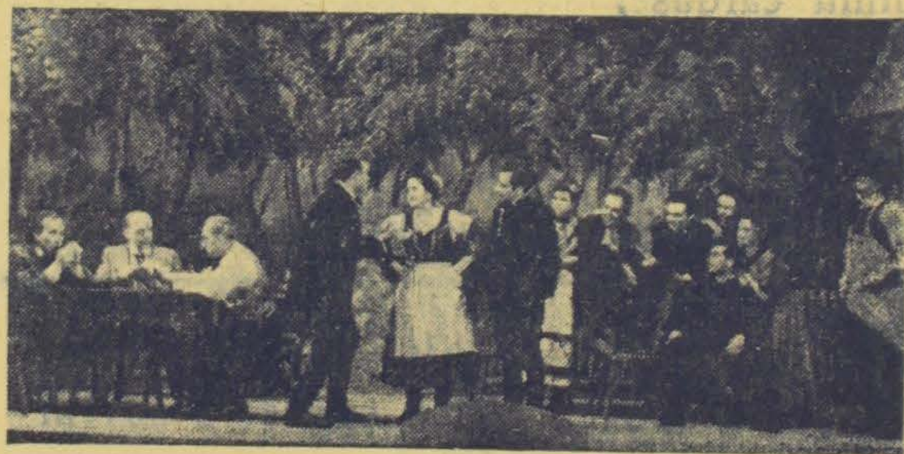
Az 5-ik kép: Fogadási jelenet