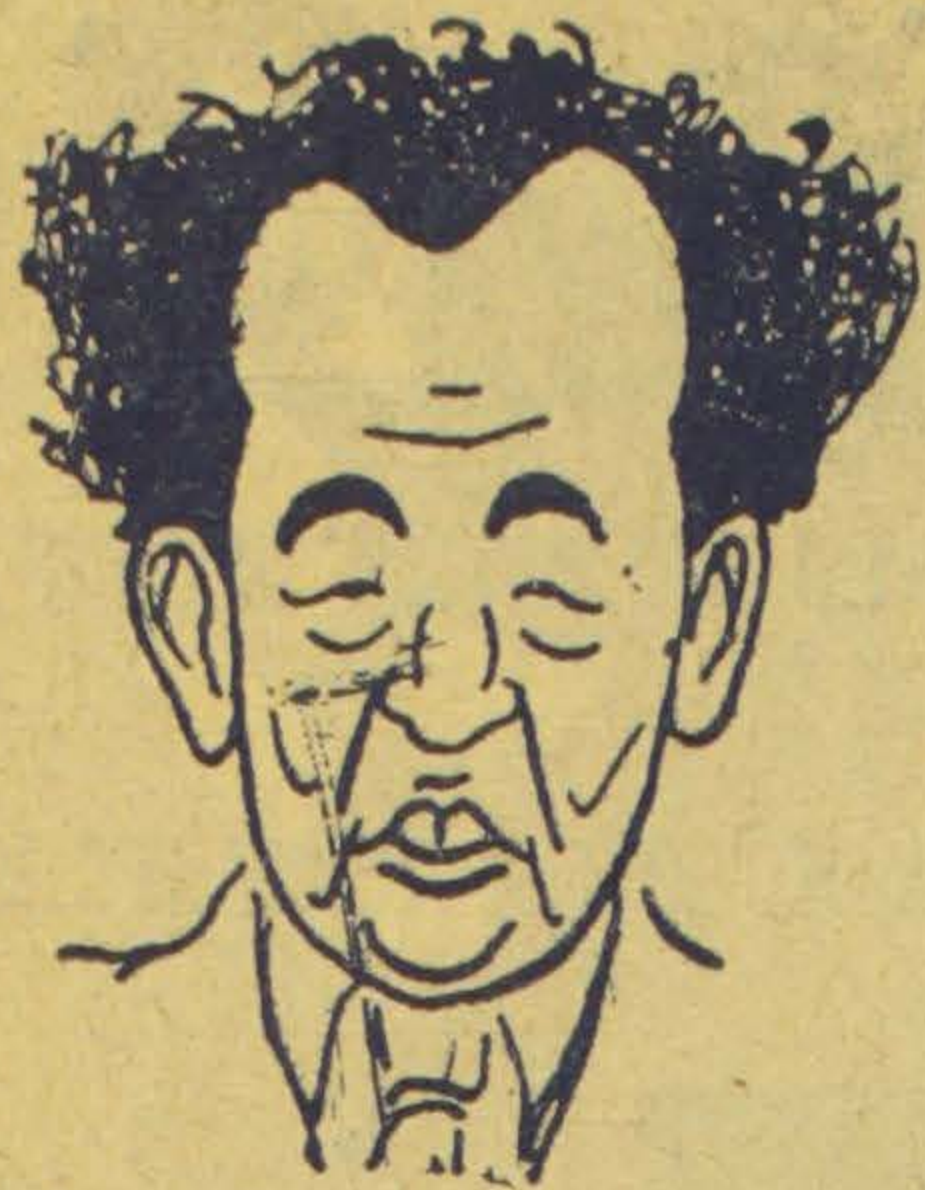
Sinkó Ervin, az „Elítéltek“ írója

A közelmúltban, az „Elítéltek“ szabadkai bemutatója alkalmából, néhány napot városunkban töltött Sinkó Ervin, az ismert irodalmár, közéleti és kultúr munkás. Ittartózkodása alatt igen érdekes és eredményes előadássorozatot tartott Szabadka polgárai és közéleti munkásai számára. Ugyanakkor élénk érdeklődést tanúsítva szindarabjának, az „Elítélteknek“ színrehozatala iránt, résztvett a darab próbáin és annak bemutatóján, melyet a szabadkai Népszínház Magyar Drámája készített elő.