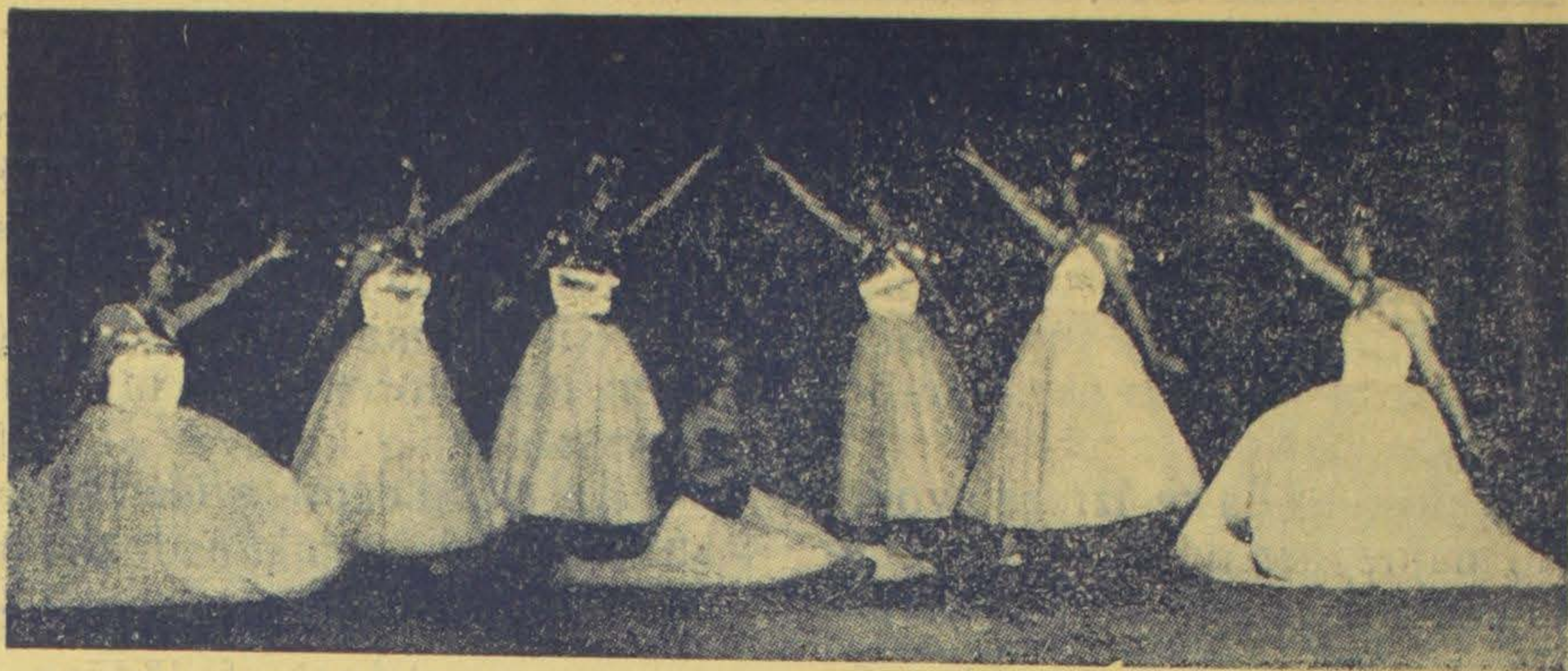
Prima balerina Anda Aranđelović (u sredini) i baletni ansambl plešu Chopinov „Valse brillante“ Angya Arangyelovity primabalerina (középen) és a balettegyüttes Chopin „Valse brillante“

oponašajući njezine pokrete. A, budući da je ples prvi od svih umjetnosti formulirao ritam (pravilno, prirodno uslovljeno izmjenjivanje suprotnosti, dana i noći, ljeta i zime, brzine i sporosti, napetosti i labavosti, napora i odmora), spontano je i ritam rada, odnosno organizirati pokreti obavljanja prvih proizvodnih načina (sjetve, žetve itd.) ubrzo izazvao ples, koji je taj rad u neku ruku „stilizirao“ kako se to danas kaže.