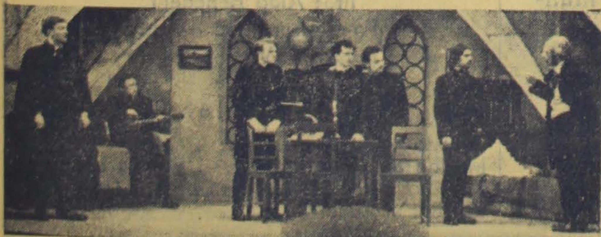
Jelenet az előjátékból