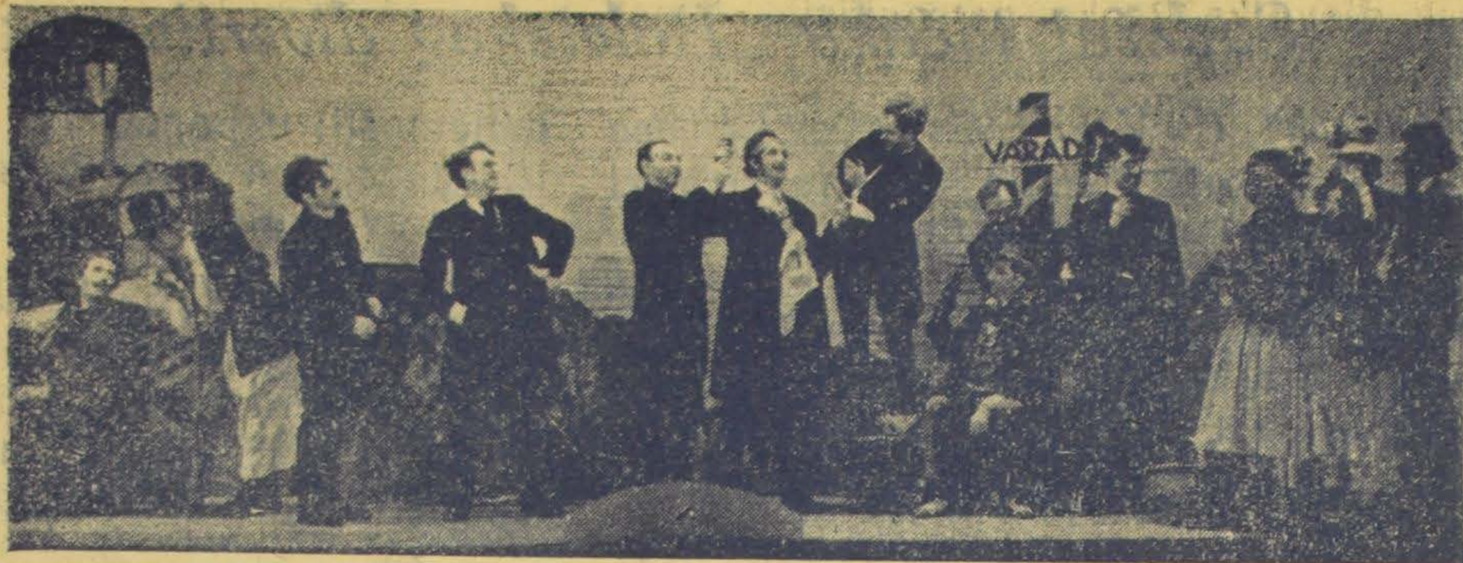
Kecsmeregi társulata az országuton 3-ik kép