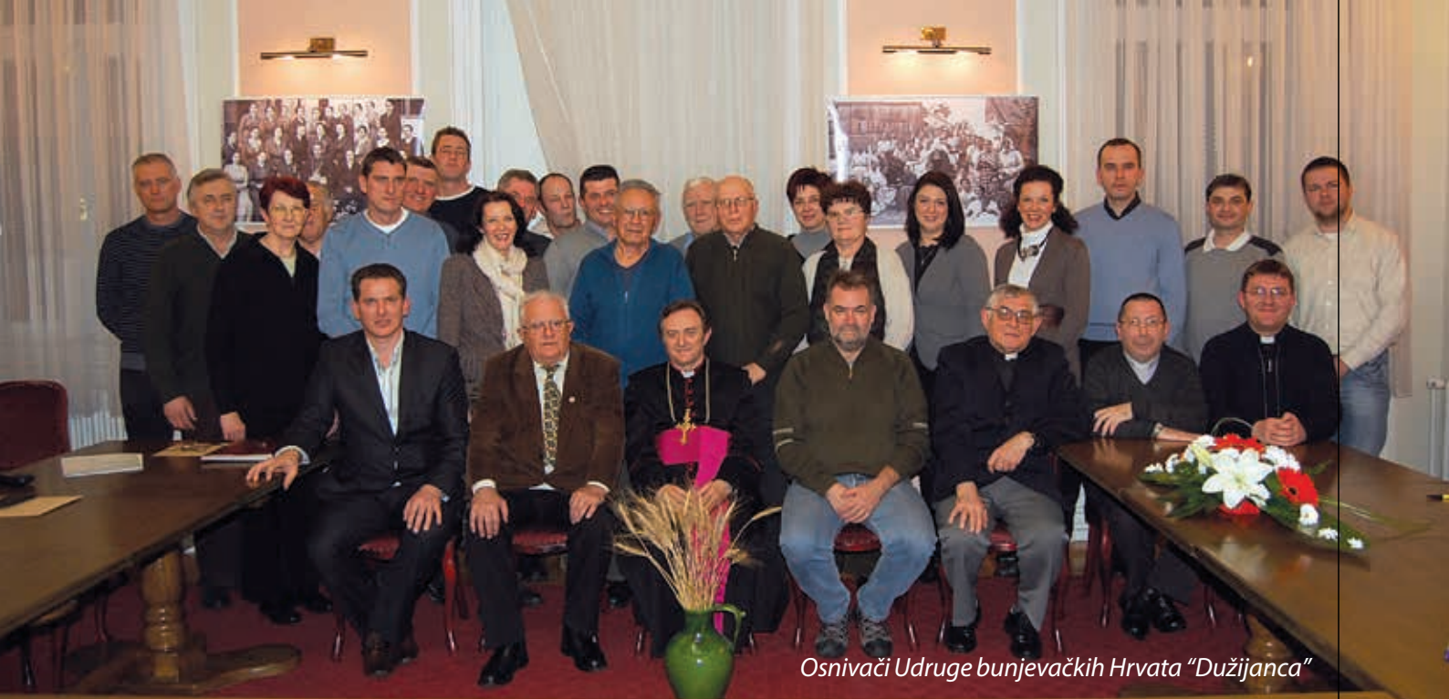
Osnivači Udruge bunjevačkih Hrvata "Dužijanca"

to zato što je Dužijanca manifestacija koja dominira svojim autoritetom i snagom u zajednici bunjevačkih Hrvata a napose kako bi na vrijeme osujetili sukobe i sva razmimoilaženja oko organiziranja te naše tradicijske manifestacije. Napose smo to učinili jer se pojavio opravdani strah da bi se postojeći sukobi i rezmimoilaženja mogli češće događati, što bi onda moglo potkopati i stogodišnju tradiciju koja živi u Dužijanci.