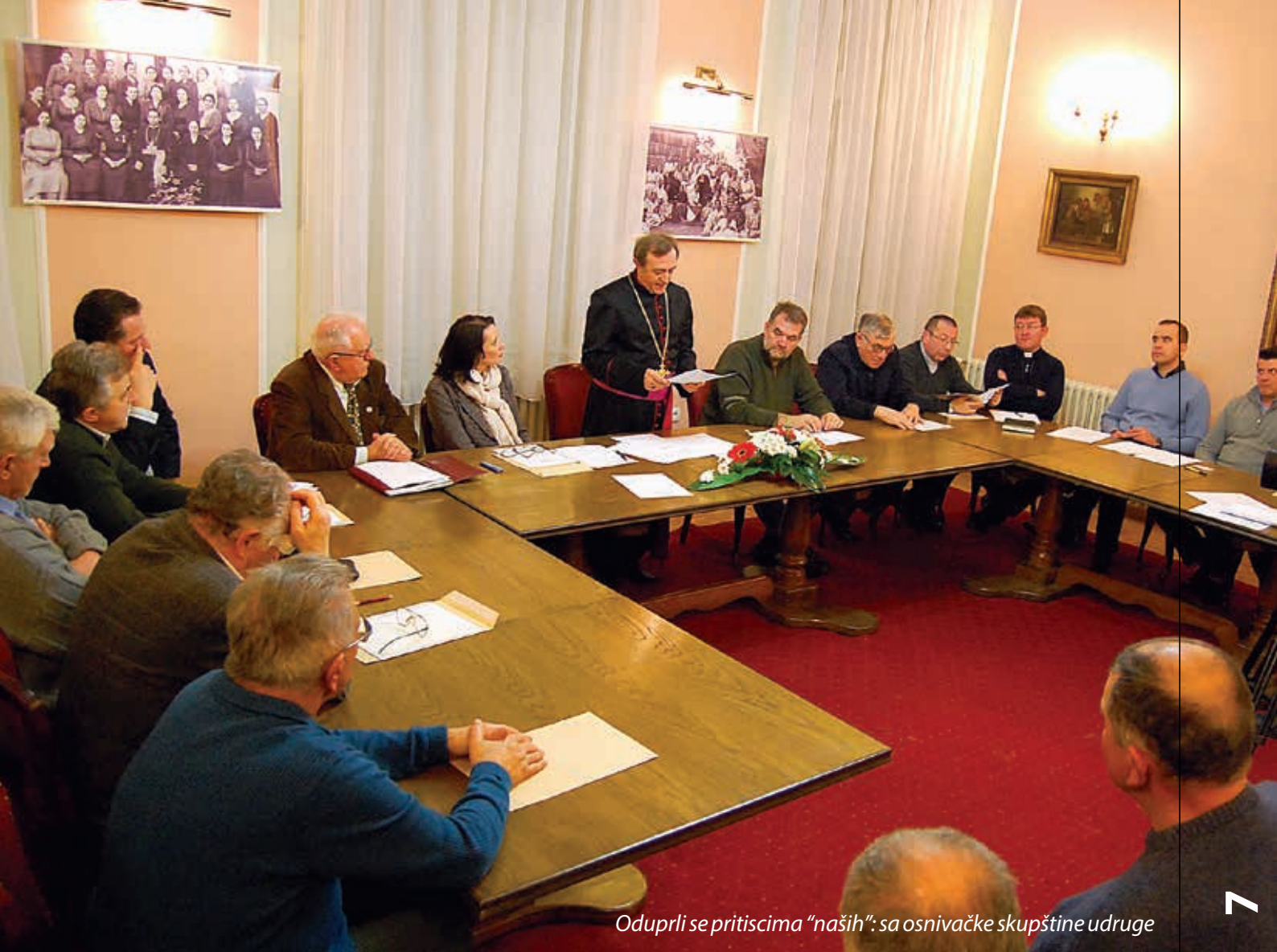
Oduprli se pritiscima "naših": sa osnivačke skupštine udruge

jedinstvenu manifestaciju s brojnim duhovno-kulturno-narodnim sadržajima.