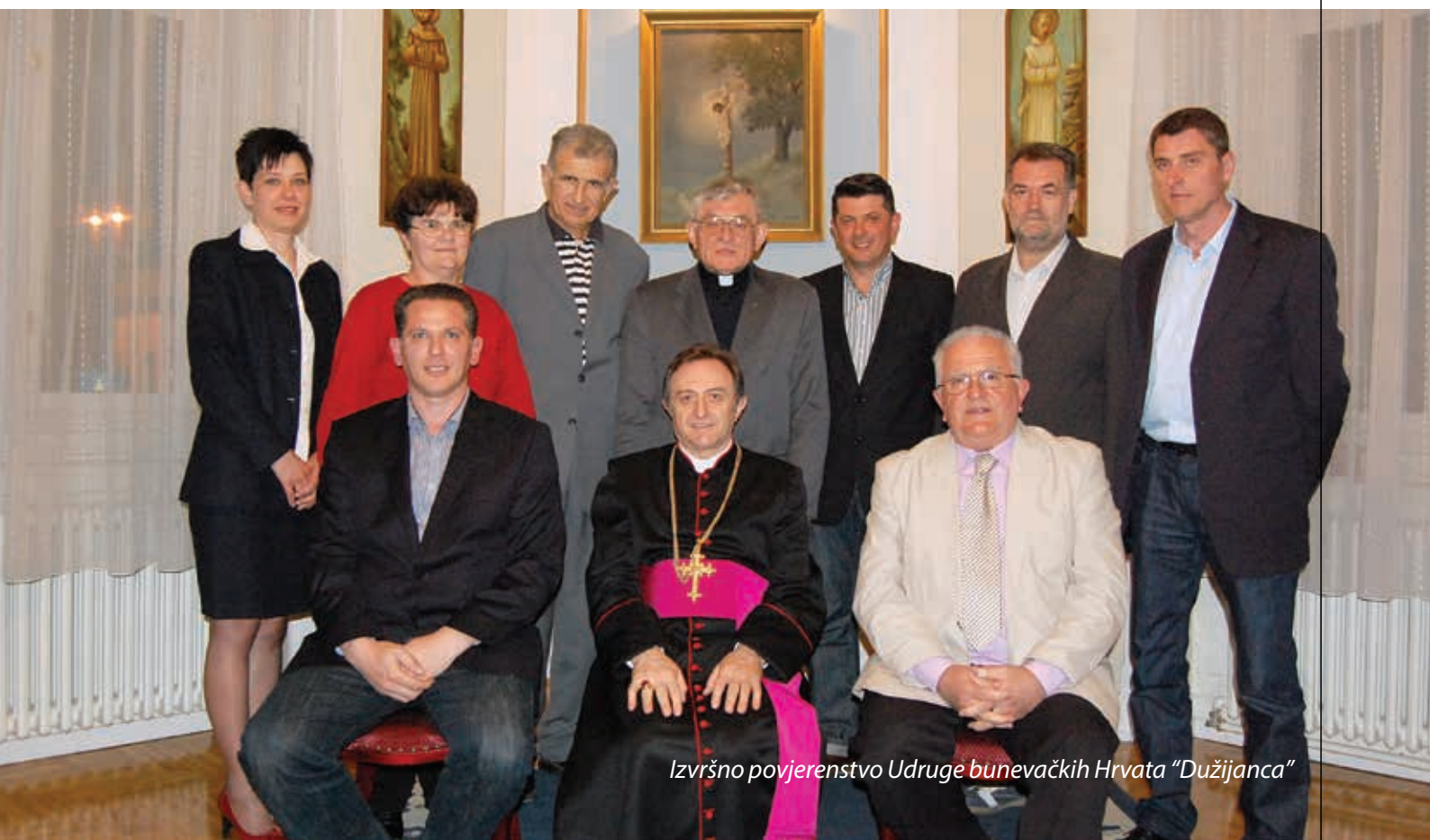
Izvršno povjerenstvo Udruge bunevačkih Hrvata "Dužijanca"