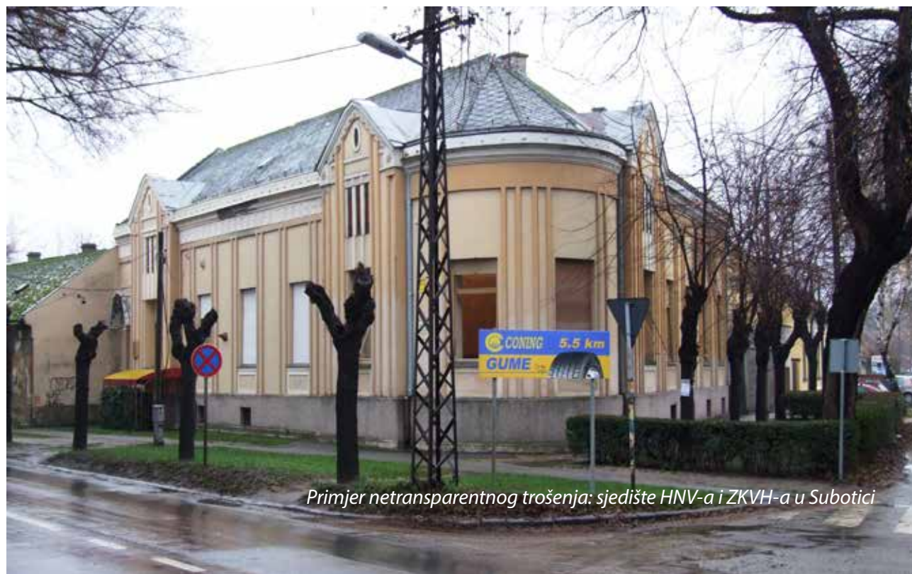
Primjer netransparentnog trošenja: sjedište HNV-a i ZKVH-a u Subotici

Ako bi izgovor sadašnjih čelnika zajednice za odbacivanje ove ideje bio taj da država ne predviđa ovakvu vrstu financiranja manjinskih zajednica, bio bi to dokaz da oni ne žele nikakve promjene i da im sadašnje stanje savršeno odgovara. Jer, ako država prihvaća da se narodnim novcem financiraju samo na papiru postojeće udruge i samo na papiru postojeće aktivnosti, onda nema razloga da ne prihvati i suštinsku pomoć zajednici, koja je ne košta ni dinar više od onoga što već daje. Država će promijeniti namjenu, samo to od nje treba zatražiti. ■