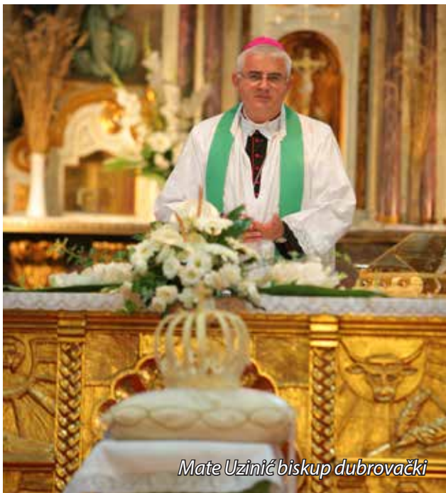
Mate Uzinić biskup dubrovački

u kojem živite. Dok danas u zahvalnosti Gospodinu s ponosom gledamo na minulo stoljeće od kada se Dužijanca slavi, želimo u ovom slavlju moliti da i mi danas budemo dostojni čuvari, graditelji i svjedoci onoga što su nam naši preci namrijeli.“