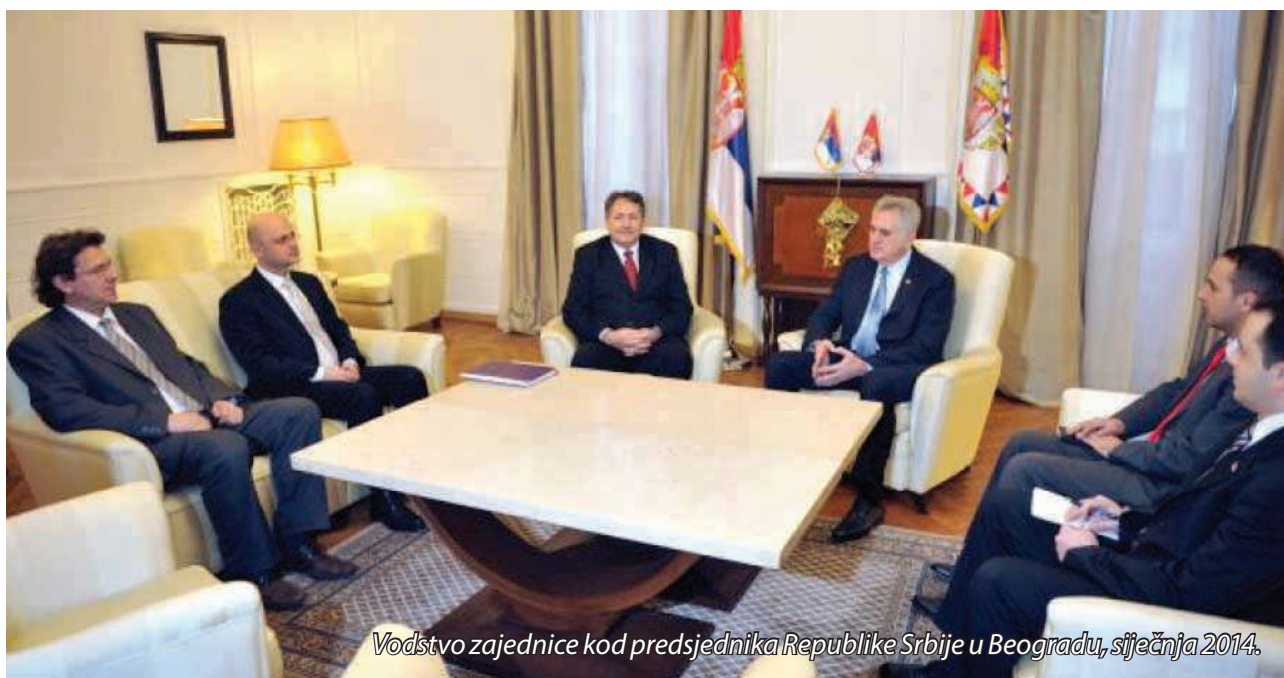
Vodstvo zajednice kod predsjednika Republike Srbije u Beogradu, siječnja 2014.

Razotkrivanje makinacija, angažiranje nadležnih državnih inspeksijskih i revizornih tijela, te maksimalno uključivanje medija na srpskom jeziku, kad već na hrvatske ne vrijedi računati, može makar na dulji rok pomoći da se u javnosti dostigne svijest o pogubnim posljedicama sjevernokorejskog načina izbora u hrvatskoj zajednici. Zelenaška mafija sama neće nikad odstupiti, to je sigurno. ■