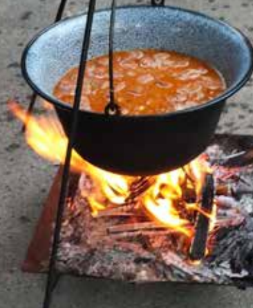
Prvi put kao dio Dužijance