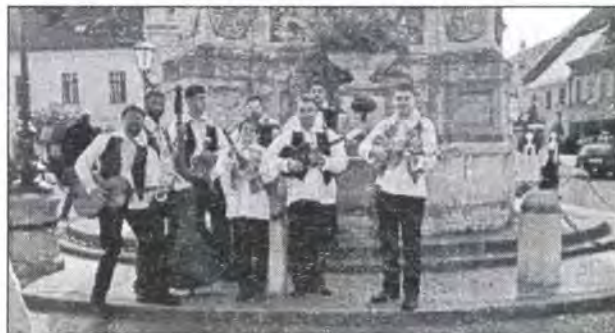
Tamburaši iz Bačkog Brega u Badenu ispred spomenika svetog Trojstva