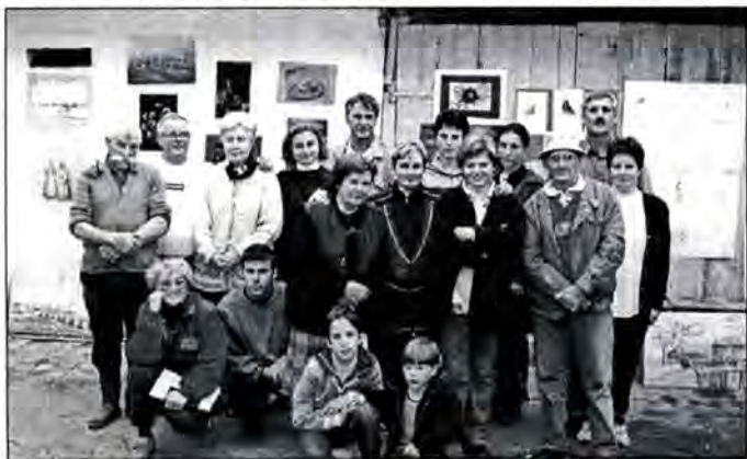
Likovna kolonija "Colorit" - Gradina

Nekoliko godina unazad pokušavamo svojim aktivnostima zainteresirati ljubitelje likovnih umjetnosti za naš rad i postojanje. Do sada smo se okupljali na izložbama upriličenim povodom svetkovina i bili smo zadovoljni utiscima posjetilaca i masovnosti istih. Sve do sada urađeno svodilo se na aktivnosti unutar zatvorenog prostora KUD-a. Nakon prijedloga da bi