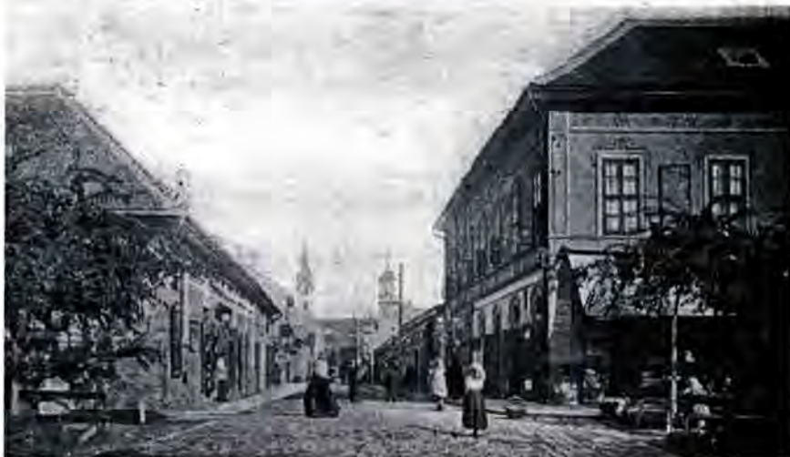
Pariska ulica 1910. Desno na uglu robna kuća Škrabala, lijevo kuća Jakobčića.

U travnju 1941. nakon sloma Jugoslavije stigli su Hóvnédi, a moja je ulica opet dobila svoje staro ime po junaku koga svojataju i Hrvati i Mađari (a tek sada smo valjda doživjeli da ih on više ne razdvaja nego spaja). Vrijeme ponovno uspostavljene "Velike Mađarske" trajalo je svega čitiri ratne godine, u Sombor je nahrupila Crvena armija, a s njom i Titovi partizani, tako da su se