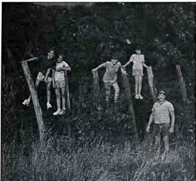
Obitelj Budimčević ispred Bortanja koji je danas u gustoj šumi

Prema Muhi Jánosu: "Kada je uništena tvrđava Bodrog ne znamo. Samo je sigurno da je tvrđava potonula u valovima Dunava. Naime, tvrđava Bodrog je sagrađena na jednom dunavskom otoku i pod nepoznatim okolnostima nestala je zajedno sa otokom."