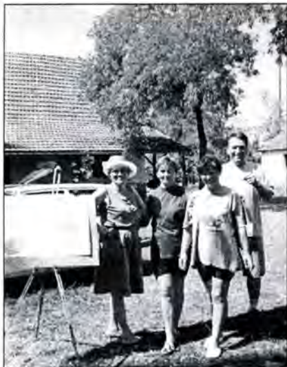
Likovna kolonija "Bunarić" - Subotica