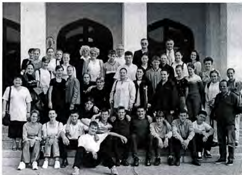
Članovi Društva u Monoštoru