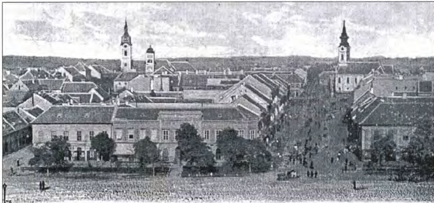
IZ STAROG ALBUMA: Sombor kako je izgledao 1899 - 1903.