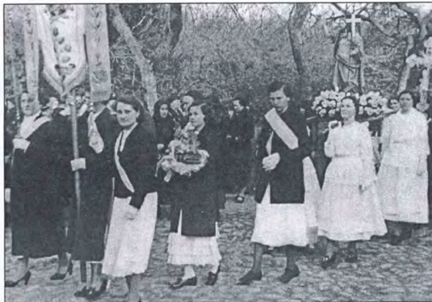
Članovi Društva u povorci za Uskrs 1938.

Du Pr svečan gačija smo c Dužio kada čanost ličana Društ prošla mladil ne no Karm toga c Plavne drugih obučer Po je post Dužion što na Dužion festacij grada zajedni jima. L da Duž događa javnost Na dimir M i dalje sadržaj postan Svi Dužion na sud manife tura ta kidivo