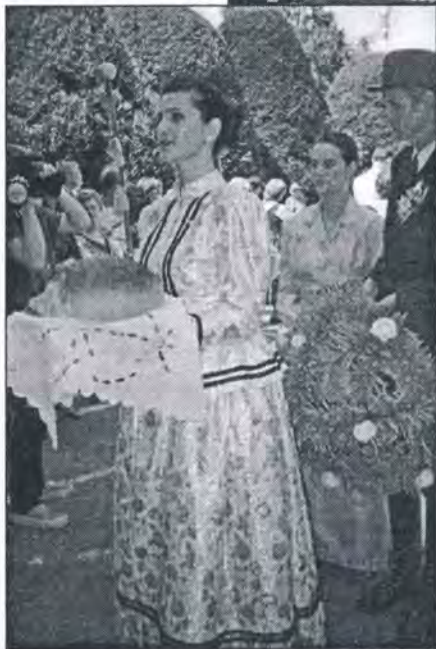
Kruh se nosi gradonačelniku Sombora