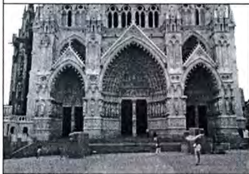
Katedrala Notre Dame u Amieniu u Francuskoj