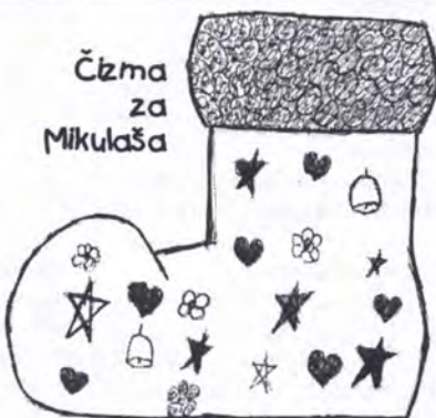
Čizma za Mikulaša