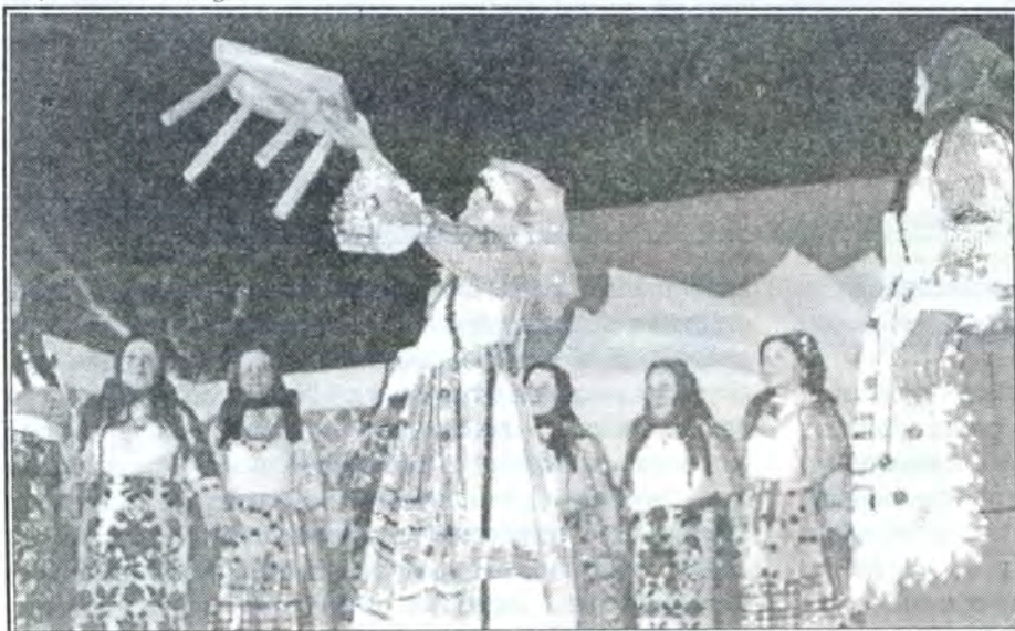
Neka vam tolika konoplja naraste

Na kraju dana, kada se obilazak kuća završi i košarka bude puna darova "Kraljice" izvrše ravnomirnu diobu između sebe. Posli nastane malo veselje i one radosne krenu svojim kućama.