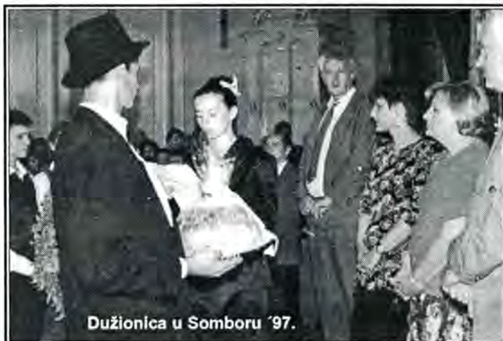
Dužionica u Somboru '97.

Kulturno umjetničko društvo "Vladimir Nazor" je slobodno i dobrovoljno udruženje građana u oblasti kulture, umjetnosti, obrazovanja i znanosti (čl.1.). Osnovni cilj Društva je da razvija i njeguje kulturu, kulturnu tradiciju, hrvatski jezik i njegov dijalekt ikavicu, folklor i običaje Hrvata ovog podneblja Bunjevaca i Šokaca (čl.5.). Najviši organ Društva je Sabor kojega čine svi redovni članovi. Ostali organi Društva su: upravni odbor (30 članova), Izvršni odbor (9 članova), Predsjednik Društva i Nadzorni odbor.