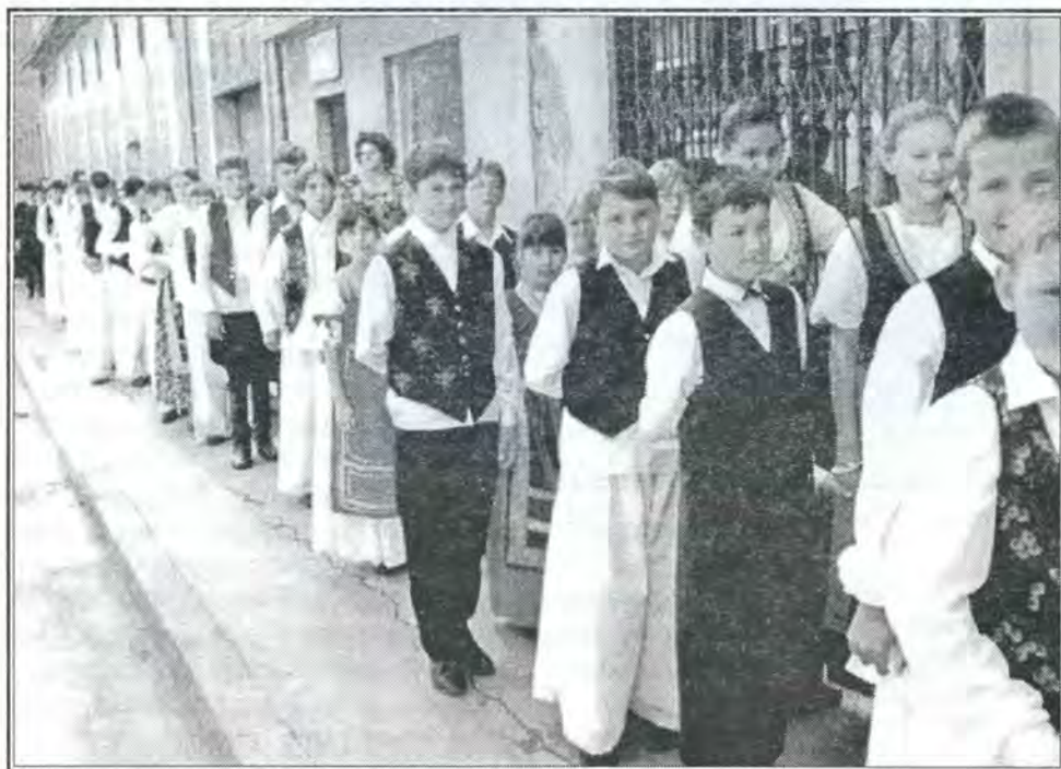
Dužionica u Somboru '97.

U Bajmoku je 26.6.1998. godine održana tradicionalna 36. smotra folkloru. Članovi mlađe grupe našeg folkloru sudilovali su na ovoj priredbi i postigli lip rezultat. Oni su se predstavili spletom bunjevačkih igara. Pored godišnjih odmora i školskog raspusta oni su se lipo pripremili za ovaj nastup i zato zaslužuju svaku pohvalu.