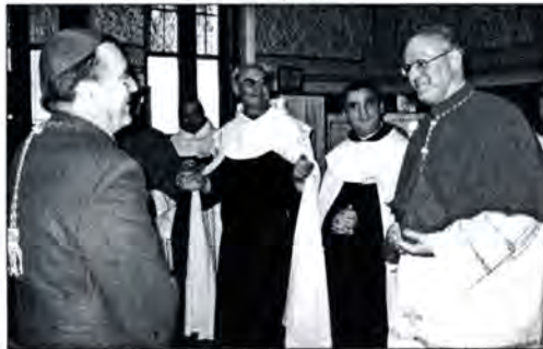
Dva kardinala msgr. Josip Bozanić i dr. Erdő Péter s domaćinima