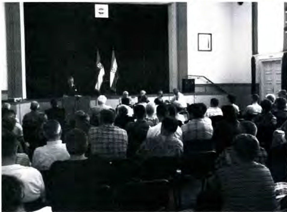
Sva godišnja izvješća dobila pozitivnu ocjenu: sa Sabora HKUD »Vladimir Nazor«

GOSTOVANJA: U izvješću o djelovanju Društva navedeno je i sudjelovanje članova pojedinih sekcija u drugim sredinama.