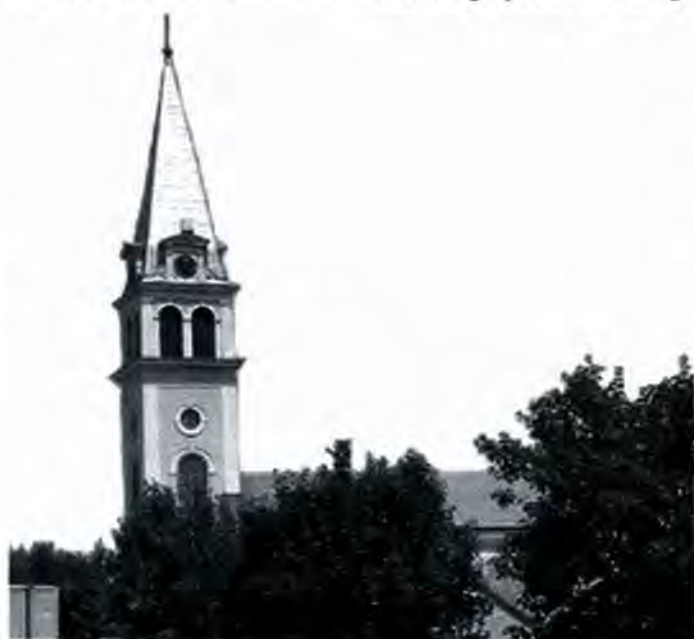
Prva Miroljubova župa: Veliškovci