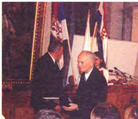
Na uručenju plakete

ručak (užinu), dok se za učenike zvono javljalo u 7 sati i 15 minuta, kako bi ih podsjetilo da krenu na nastavu.