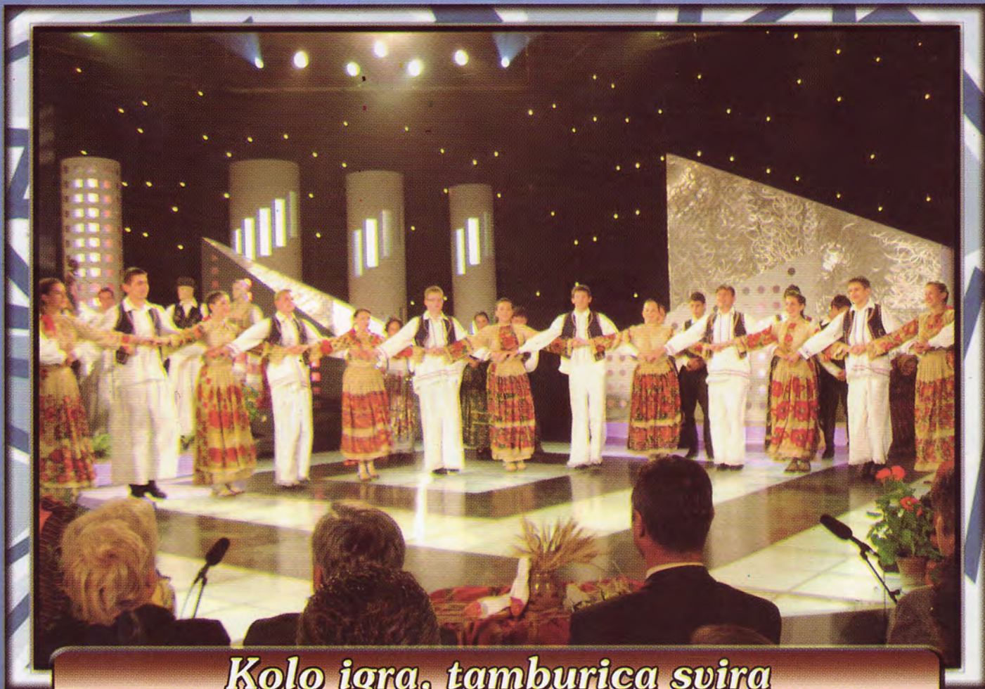
Kolo igra, tamburica svira