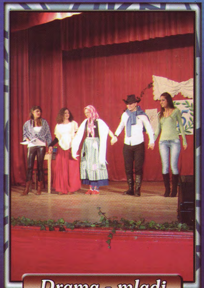
Drama - mladi