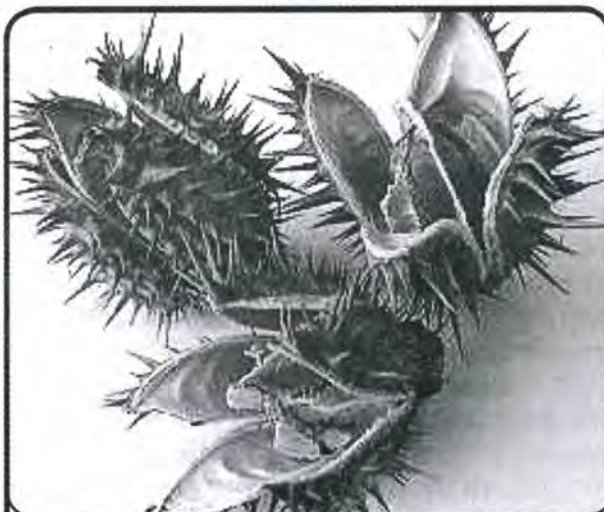
Slika 3. Plod tatule