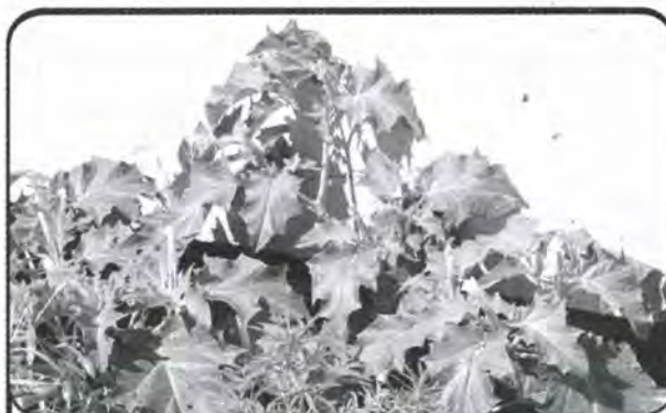
Slika 1. Tatula ( Datura stramonium )

Tatula je jednogodišnja biljka. Stabljika može narasti i preko jednog metra. Cvjetovi imaju karakteristični "trubasti" oblik (stoga njezin naziv na engleskom glasi "đavolova truba" ali i "anđelova truba"). Cvjetovi su bijeli ili blijedo-ljubičasti, vrlo slabog mirisa. Plod tatule je krupna čahura, s kratkim mekanim bodljama. Kada sazri, plod se otvara, i iz njega ispadaju sjemenke tamne boje. Svi dijelovi biljke su otrovni, a naročito listovi, plod i sjemenke.