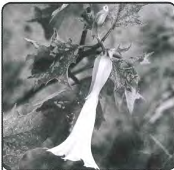
Slika 2. Cvijet tatule