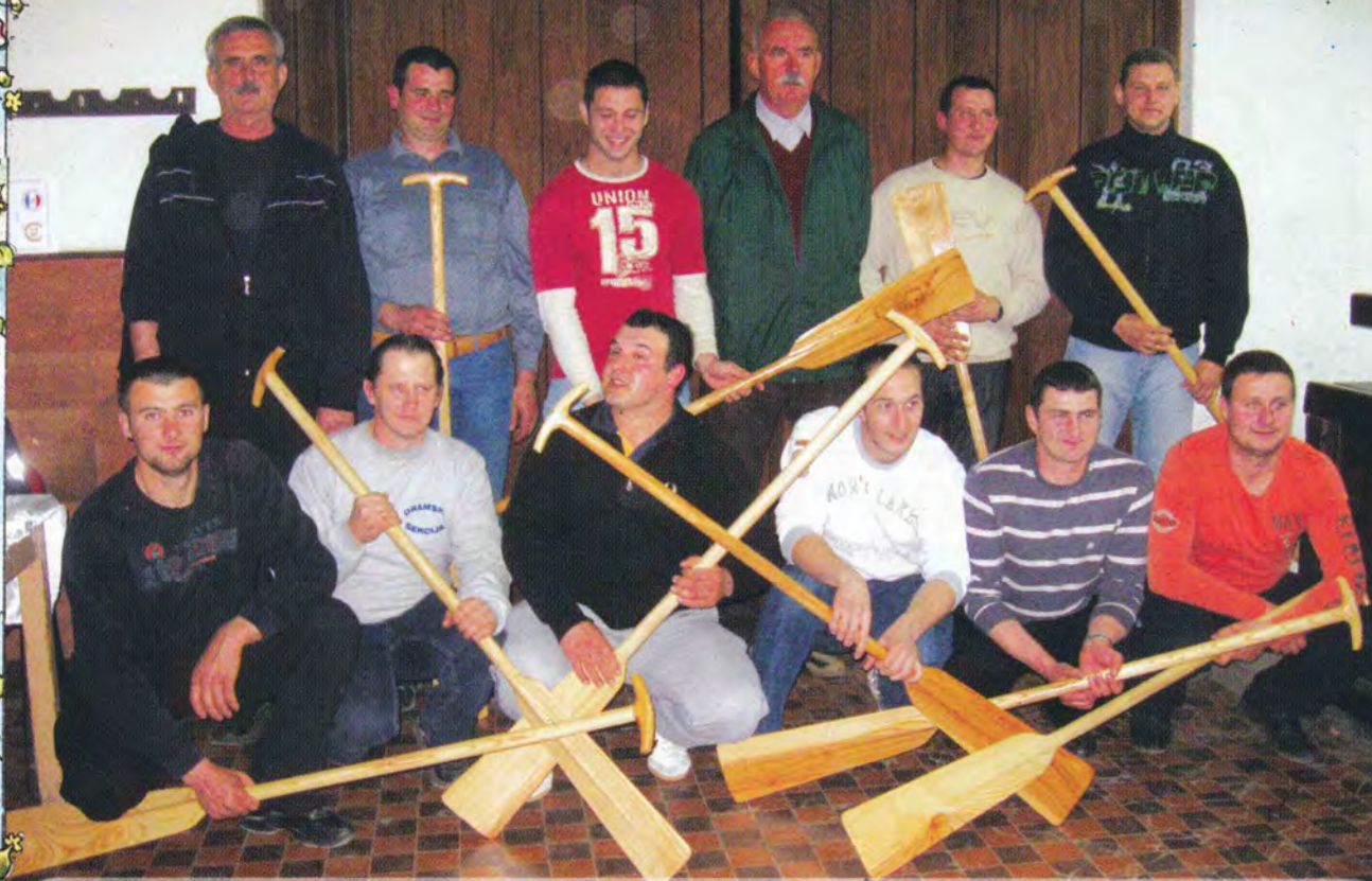
VESLAČI-LAĐARI NA NERETVI 2011 GODINE.