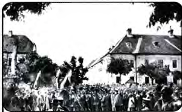
Neredi orjunaša, srnaovaca, dobrovoljaca i pašićevih radikala na skupštini HSS prilikom objave sjedinjenja BŠS i HSS