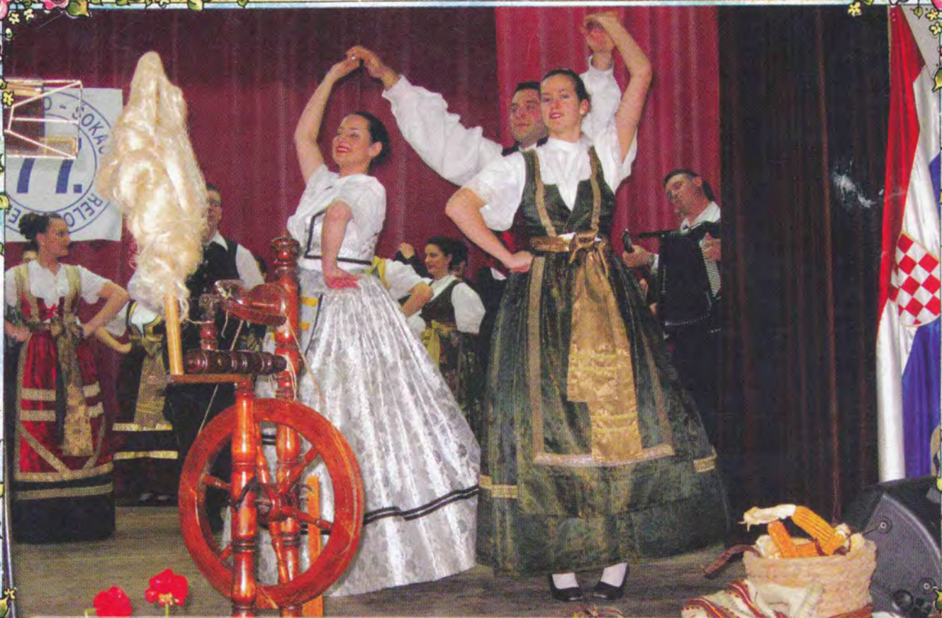
77. PRELO U SOMBORU