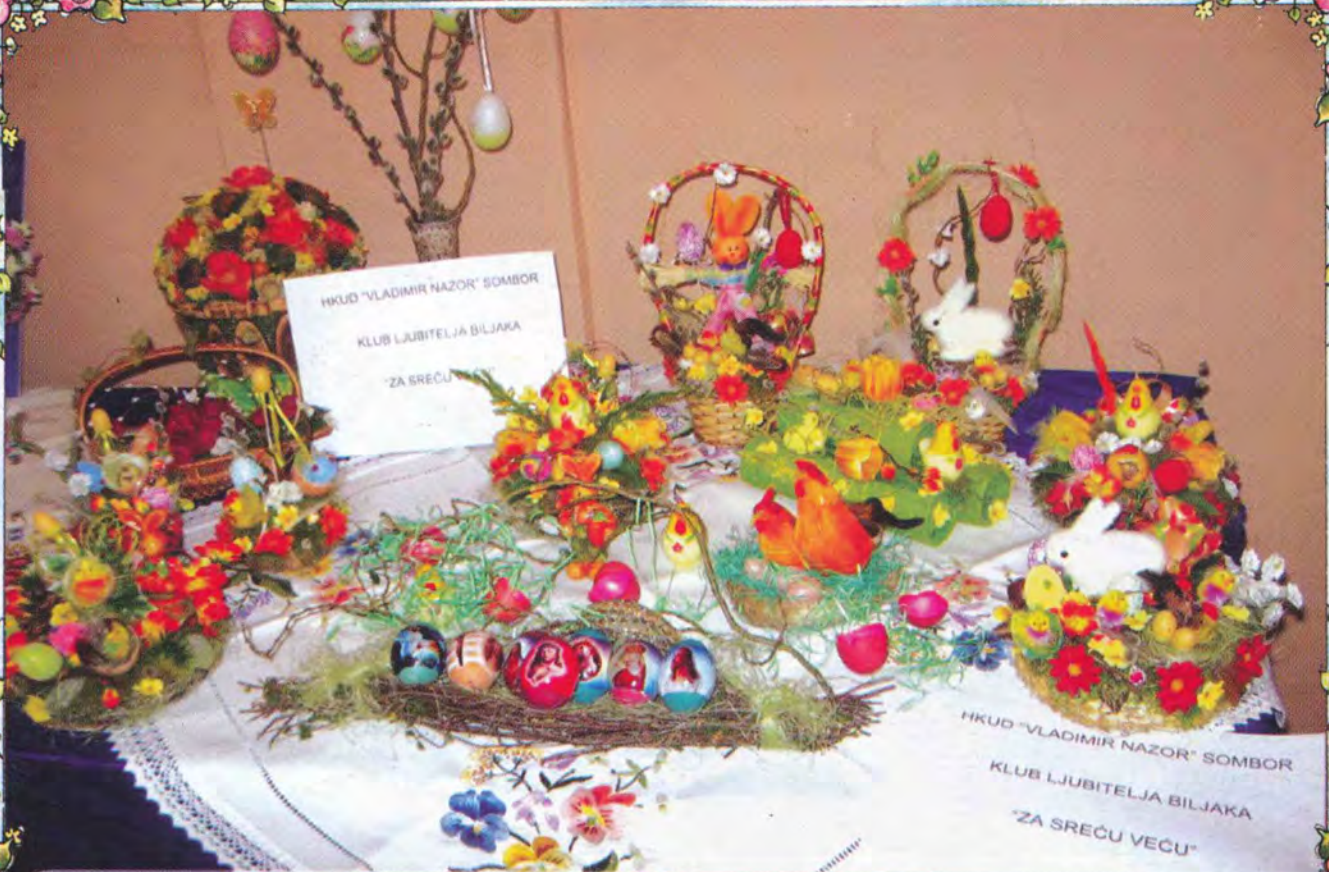
USKRSNA IZLOŽBA U SOMBORU