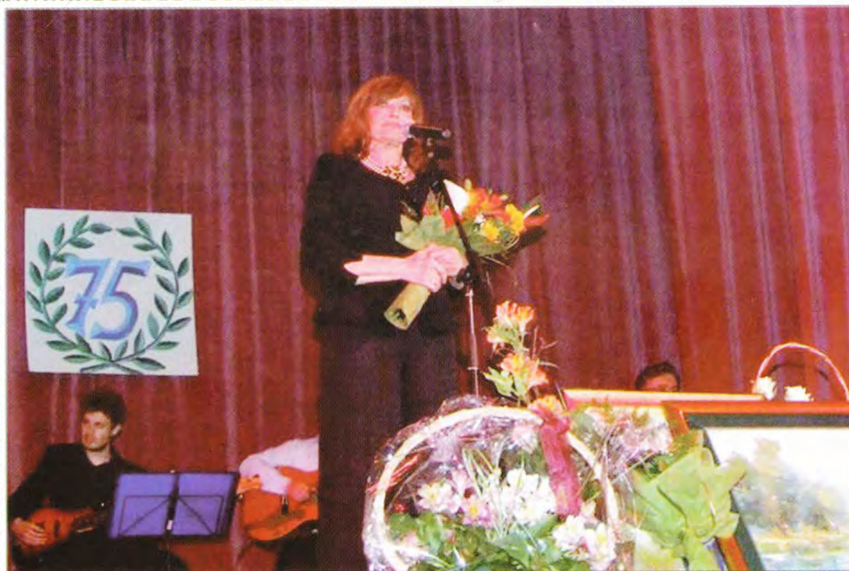
Koncert Tereze Kesovije