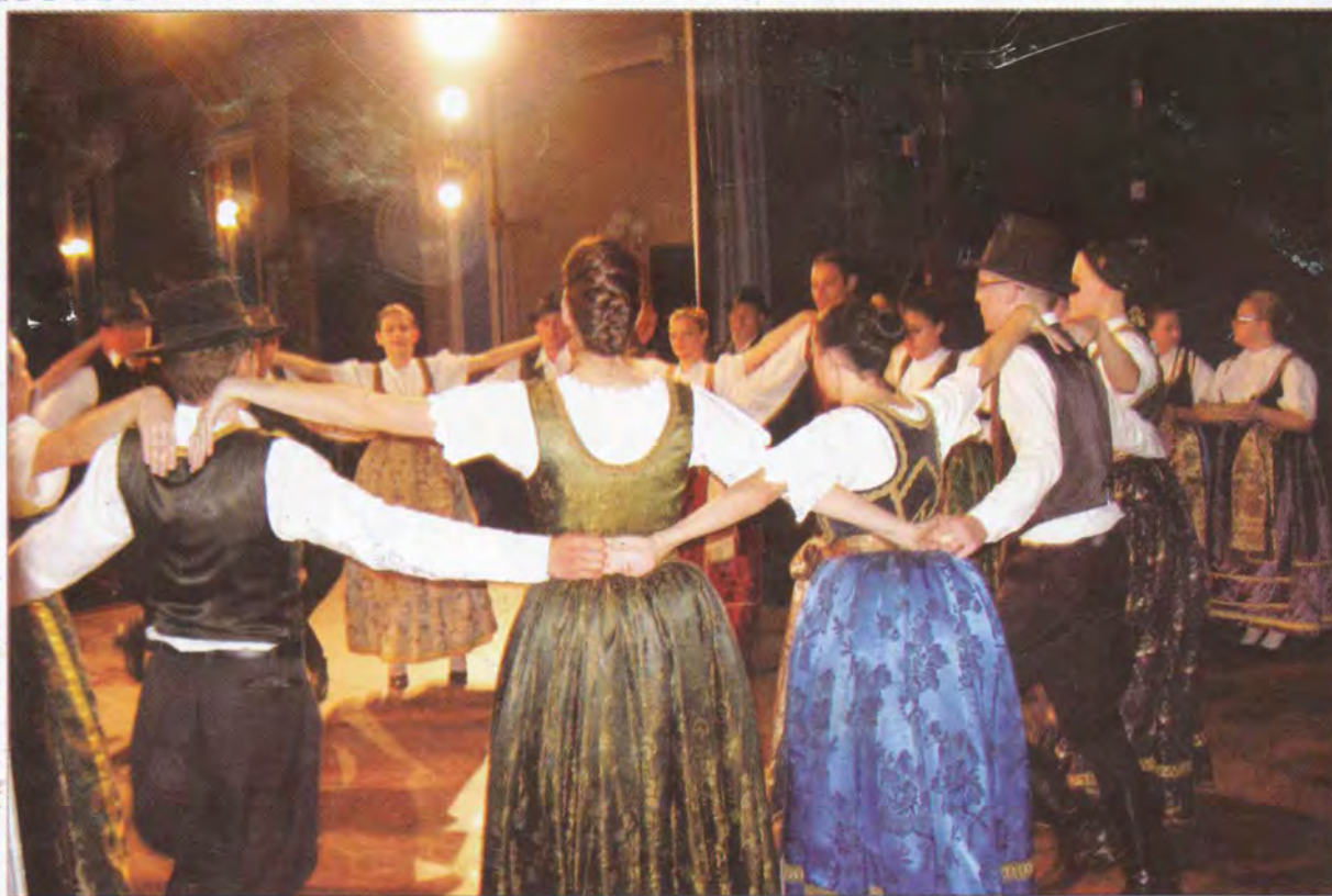
Zonska smotra - Apatin