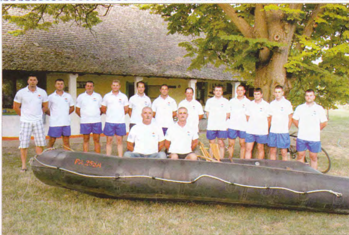
Salašari somborski HKUD "Vladimir Nazor"