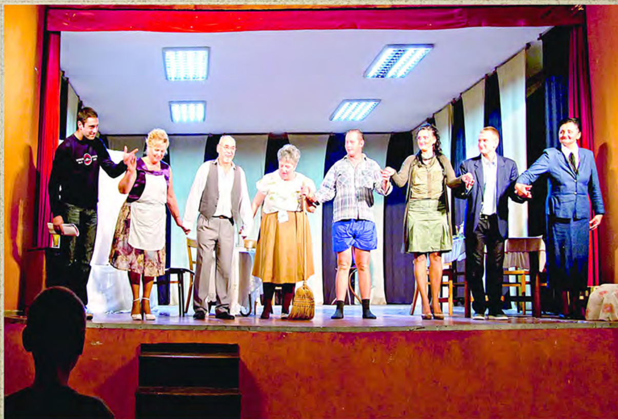
Dramska sekcija u Svetozaru Miletiću