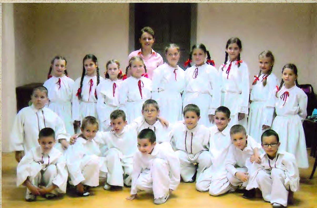
Dječja folklorna skupina