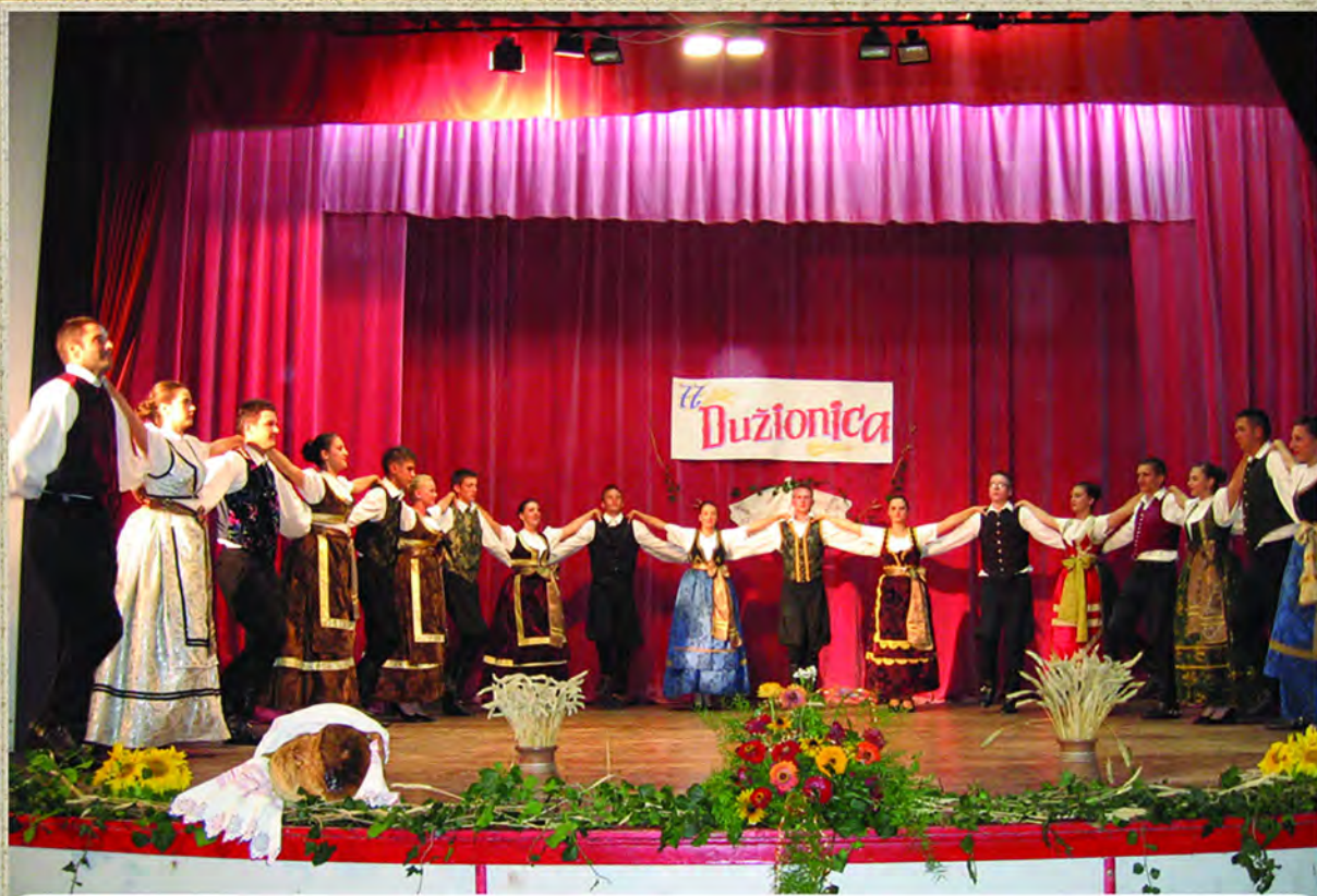
Somborska Dužionica 77