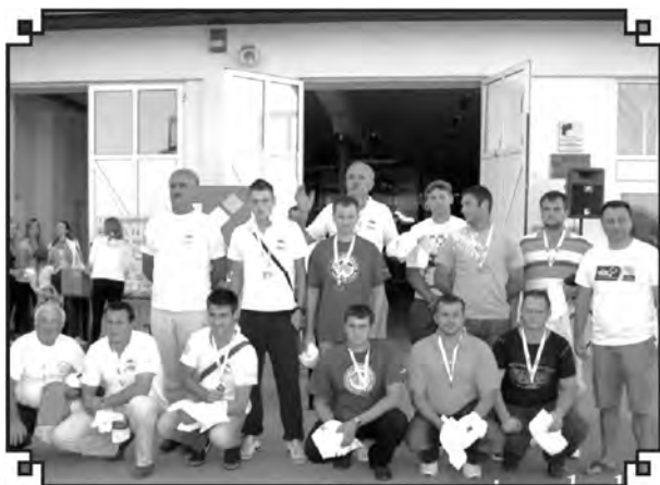
Slika s maratona: Vukovar - Ilok