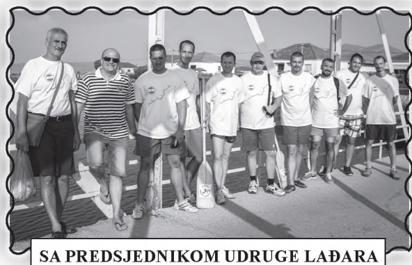
SA PREDsjedNIKOM UDRUGE LAĐARA