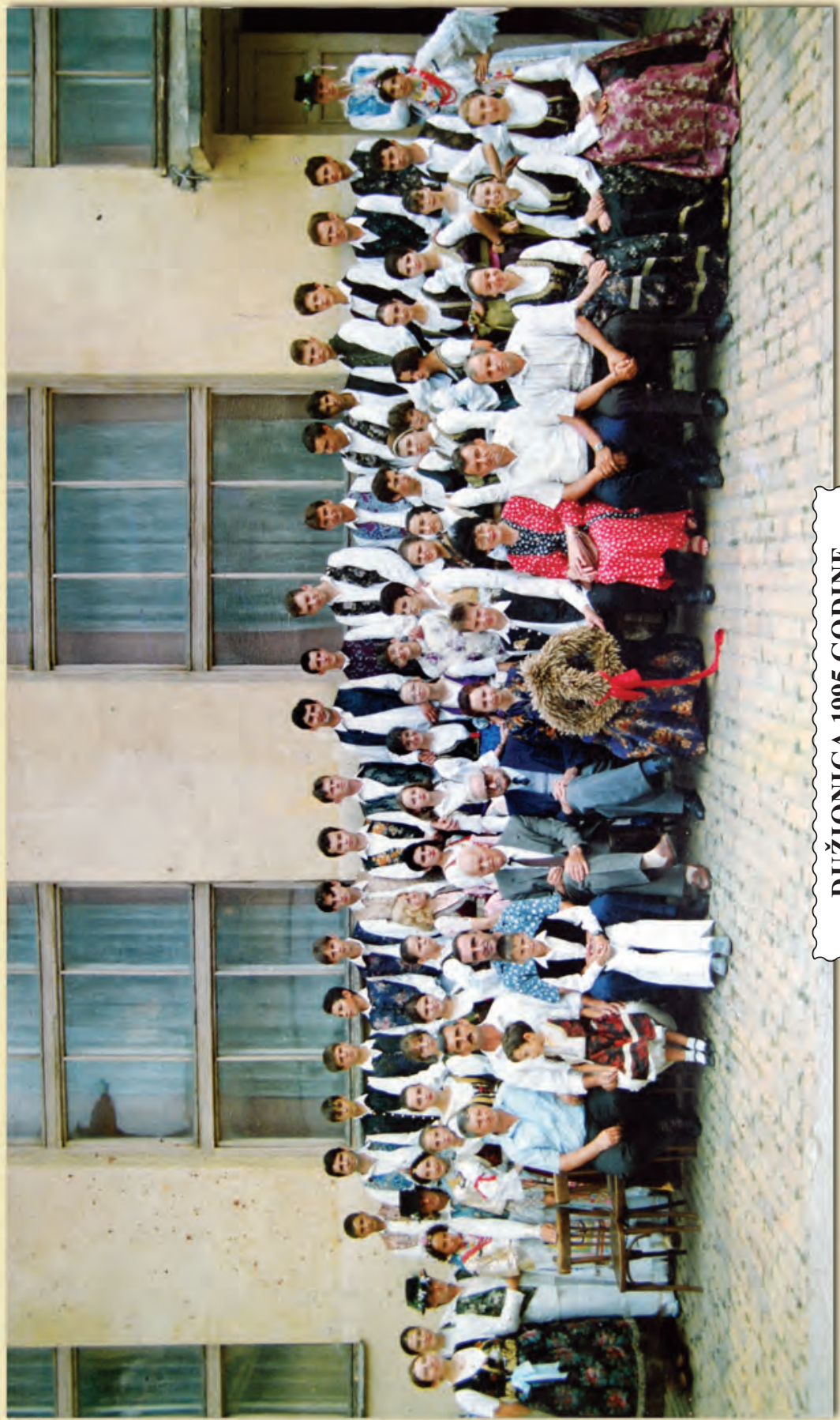
DUŽIONICA 1995. GODINE