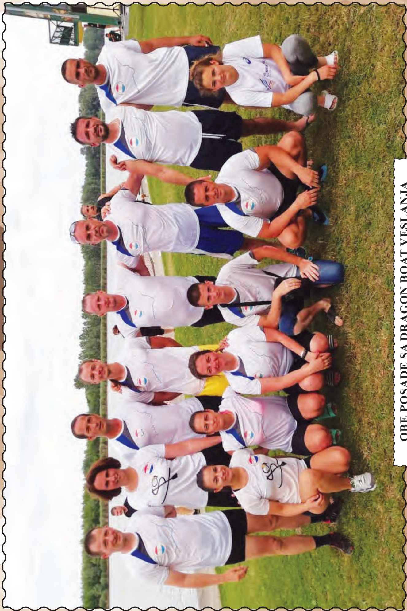
OBE POSADE SA DRAGON BOAT VESLANJA