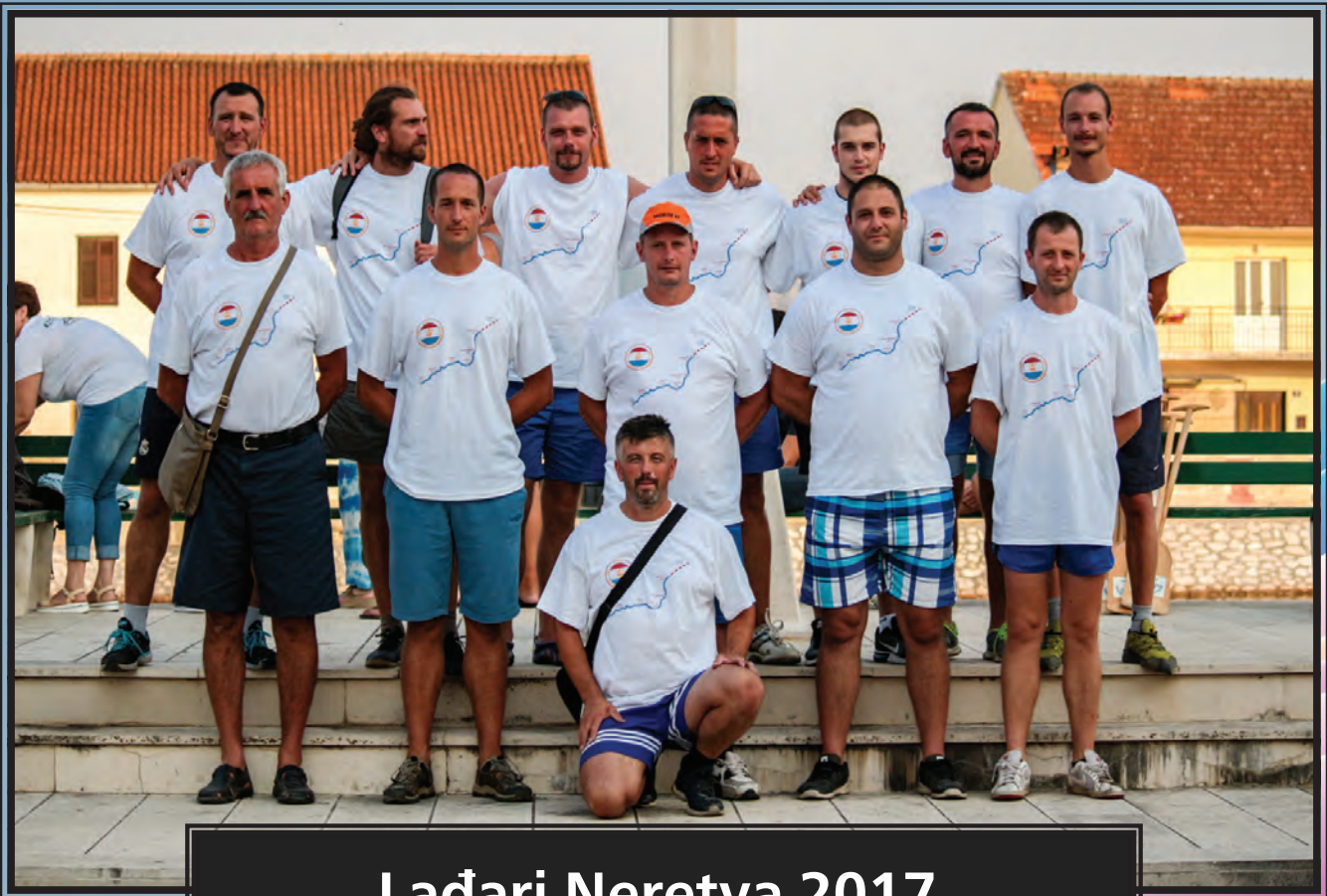
Ladari Neretva 2017.