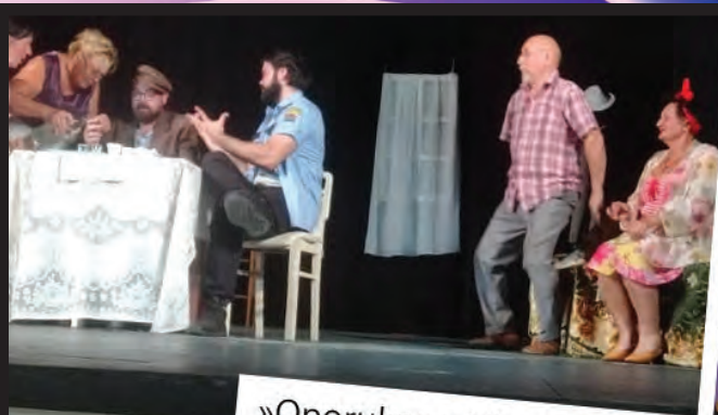
»Oporuka« u Vitezu i Sinju