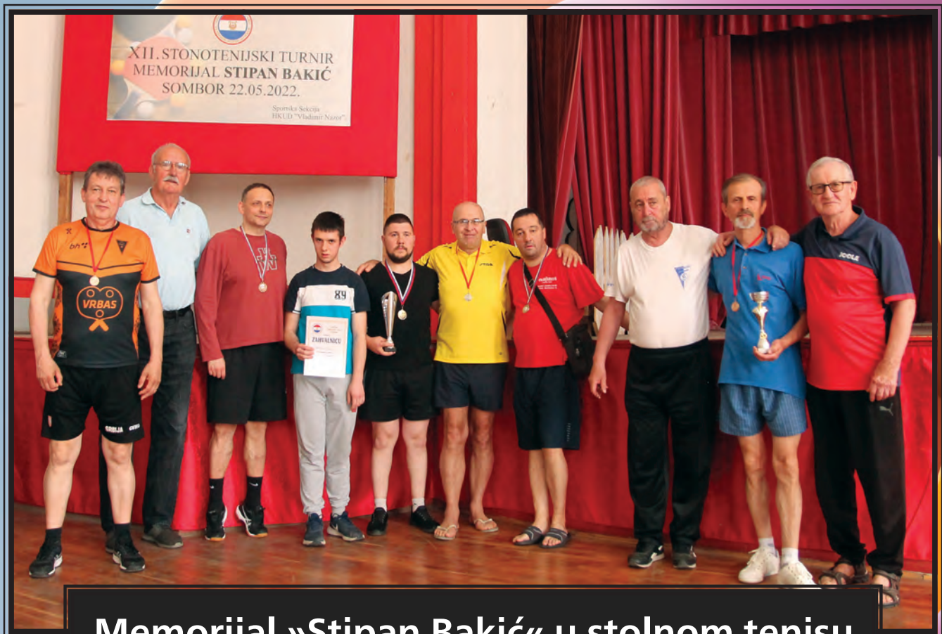
Memorijal »Stipan Bakić« u stolnom tenisu