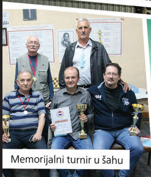
Memorijalni turnir u šahu