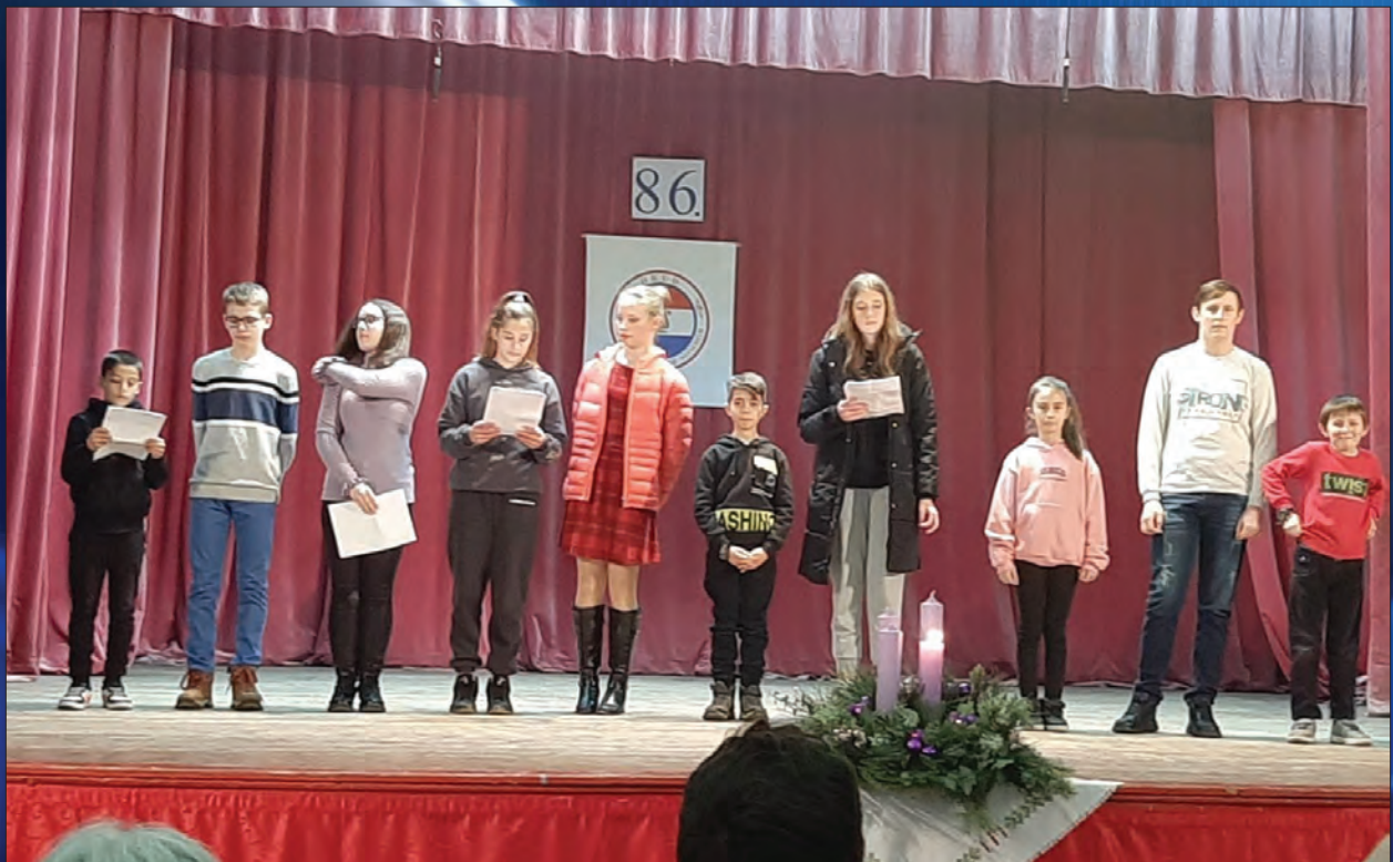
NAŠI MALI RECITATORI