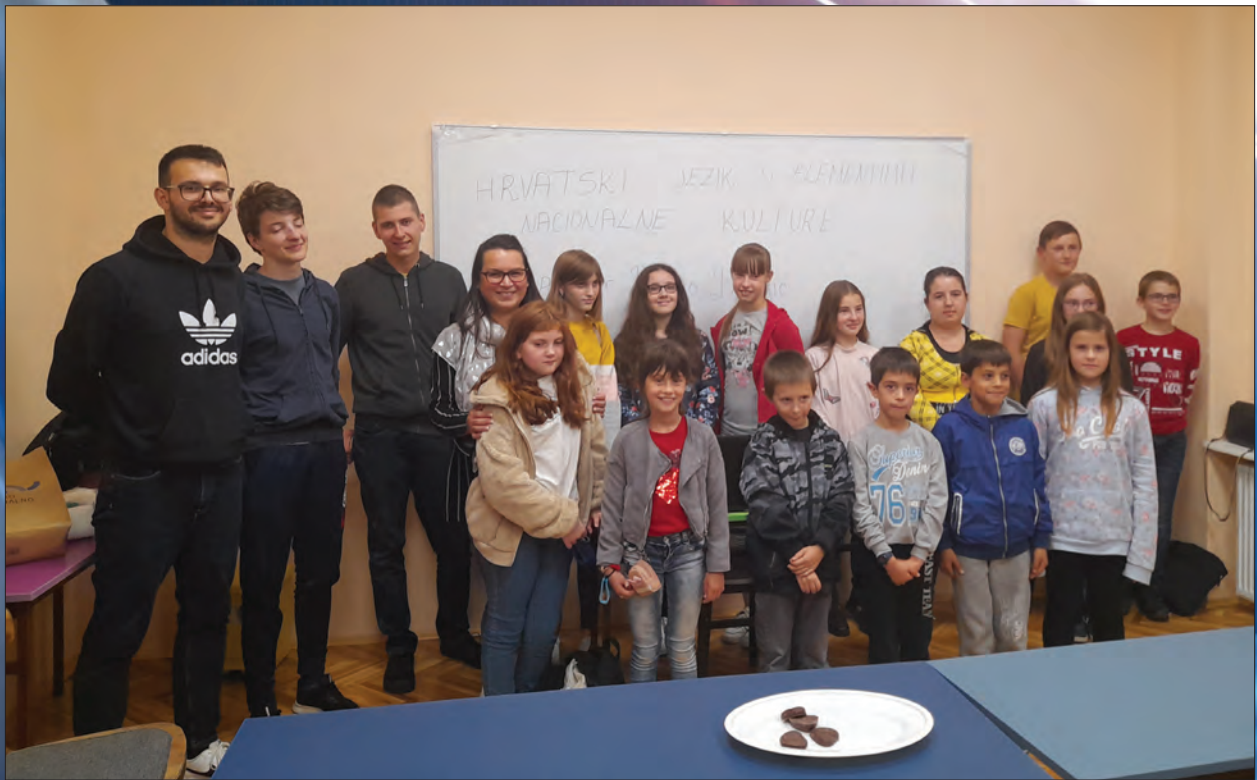
POLAZNICI ŠKOLE NA HRVATSKOM JEZIKU