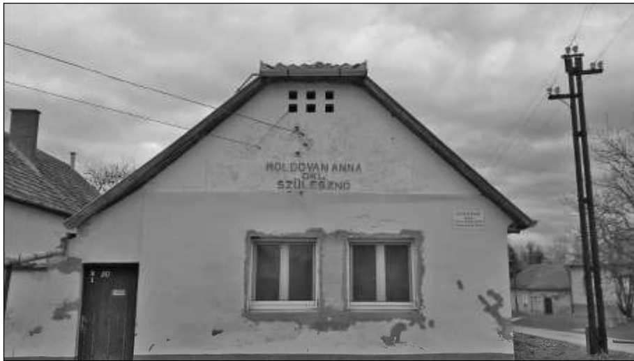
Slika 1. Kuća babice Ane Moldovan u Santovu. Snimila Nikolina Vuković 2016. godine.

Sve do šezdesetih godina 20. stoljeća, žene su radale kod kuće stoga je u selu postojala babica koja im je pomagala pri porodu. Babice su bile isključivo žene. U